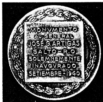
Pieza 11 y 12