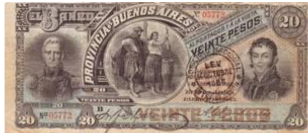
20 Pesos Moneda Nacional Oro Emisor: Banco de la Provincia de Buenos Aires Anverso: Cornelio Saavedra (izquierda) y General Juan M. Pueyrredón (derecha) Reverso: Valor en números Año: 1885