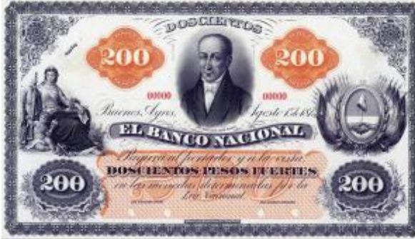
200 Pesos Fuertes Emisor: Banco Nacional Anverso: Juan José Paso Año: 1873