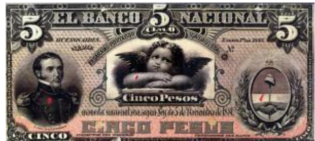
2 Pesos Moneda Nacional Oro Emisor: Banco Nacional Anverso: Manuel Dorrego Reverso: Año: 1883