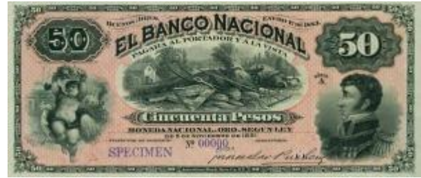
50 Pesos Moneda Nacional Oro Emisor: Banco Nacional Anverso: Marcos González Balcarce Reverso: Valor en números Año: 1883