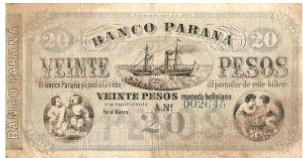
20 Pesos Moneda Boliviana Emisor: Banco Paraná Anverso: Barco Año: 1868