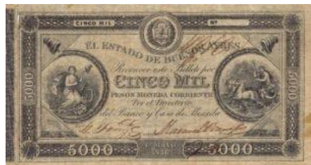
5.000 Pesos Moneda Corriente Emisor: El Estado de Buenos Ayres Anverso: El dios Poseidón de la mitología griega, derecha y mujer a la izquierda Año: 1856