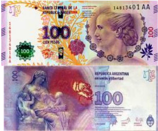
100 Pesos (Serie AA en adelante) Tamaño: 155 x 65 mm Anverso: María Eva Duarte de Perón Reverso: Detalle del friso del altar romano de la Paz de Augusto (Ara Pacis) Color: Violeta Vigencia: Actual