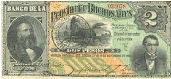
2 Pesos Moneda Nacional Oro Emisor: Banco de la Provincia de Buenos Aires Anverso: Adolfo Alsina (izquierda) y Florencio Varela (derecha) Reverso: Valor en números Año: 1885