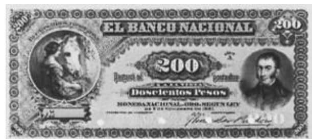
200 Pesos Moneda Nacional Oro Emisor: Banco Nacional Anverso: Reverso: Año: 1883