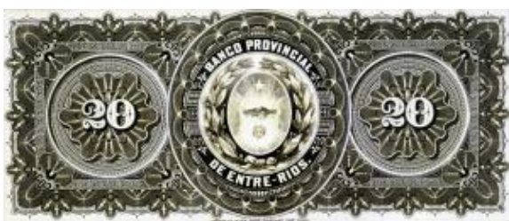
20 Pesos Moneda Nacional Oro Emisor: Banco Provincial de Entre Ríos Anverso: General Lucio Mansilla Reverso: Escudo provincial Año: 1885