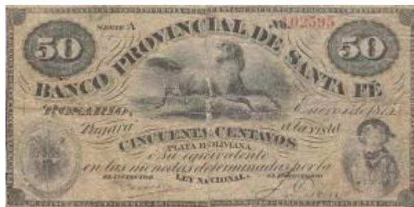
50 Centavos Plata Boliviana Emisor: Banco Provincial de Santa Fe Anverso: Caballos Año: 1875