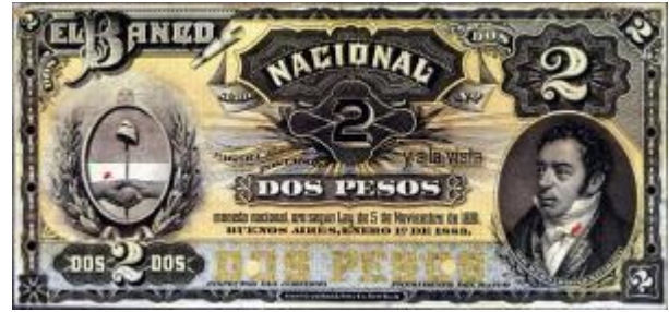
2 Pesos Moneda Nacional Oro Emisor: Banco Nacional Anverso: Bernardino Rivadavia Reverso: Valor en números Año: 1883