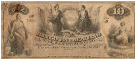
10 Pesos Moneda Boliviana Emisor: Banco Entre-Riano Anverso: Alegorías femeninas Año: 1870