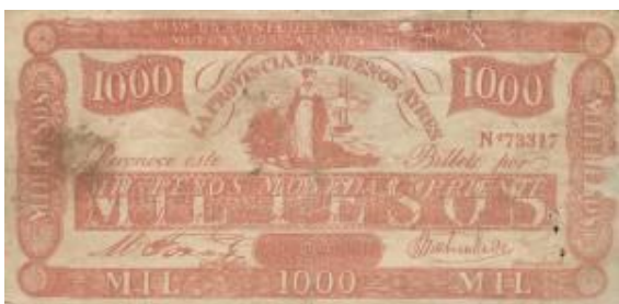
1.000 Pesos Moneda Corriente Emisor: Casa de Moneda de la Provincia de Buenos Ayres Leyenda: "Viva la Confederacion

Argentina... Mueran los Salvajes Unitarios" Anverso: Alegoría femenina Año: 1847