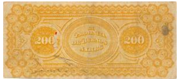
200 Pesos Moneda Corriente Emisor: Banco de la Provincia de Buenos Ayres Anverso: General Carlos María de Alvear Año: 1869