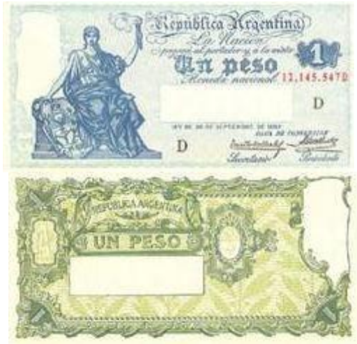
1 Peso Tamaño: 130 x 65 mm Anverso: Efigie del Progreso Reverso: Escudo Nacional Vigencia: 1899-1935