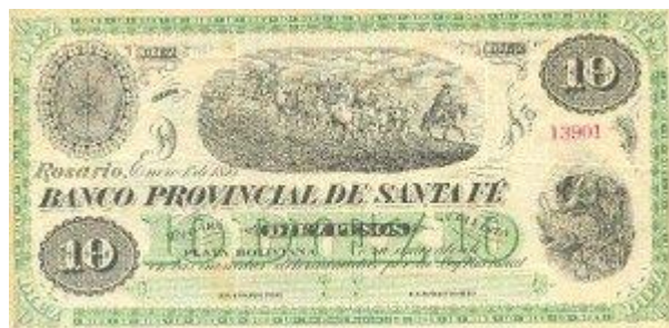
10 Pesos Plata Boliviana Emisor: Banco Provincial de Santa Fe Anverso: Gauchos, perro Año: 1875