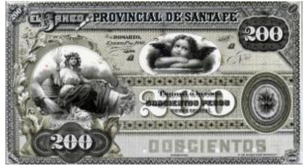
200 Pesos Moneda Nacional Emisor: Banco Provincial de Santa Fe Anverso: Mujer, escudo provincial Reverso: Mujer y ovejas Año: 1882