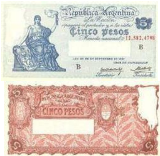
5 Pesos Tamaño: 145 x 73 mm Anverso: Efigie del Progreso Reverso: Escudo Nacional Vigencia: 1899-1935