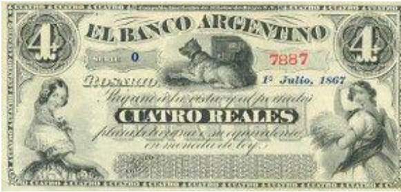
4 Reales Plata Boliviana Emisor: Banco Argentino (Rosario) Anverso: Perro Año: 1867