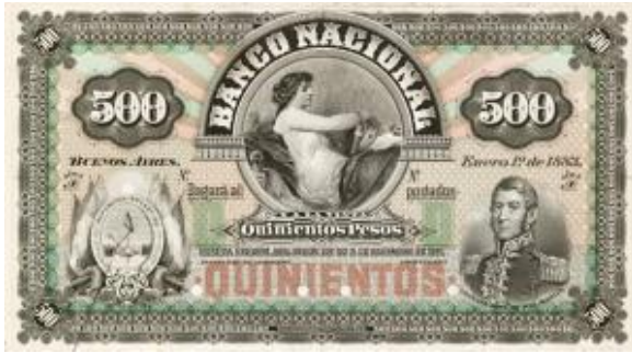
Anverso: Gral. Martín Rodríguez Reverso: Cabeza de Mercurio. Valor en números Año: 1883