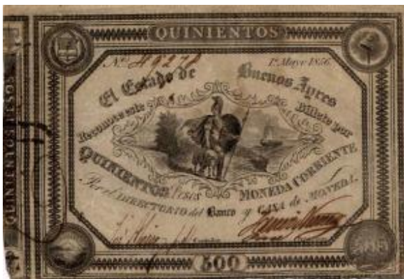
500 Pesos Moneda Corriente Emisor: El Estado de Buenos Ayres Anverso: Año: 1857