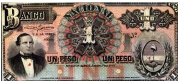
1 Peso Moneda Nacional Oro Emisor: Banco Nacional Anverso: Santiago Derqui Reverso: Año: 1883