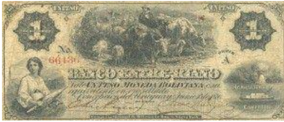
1 Peso Moneda Boliviana Emisor: Banco Entre-Riano Anverso: Vacas y ovejas Año: 1870