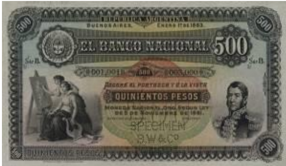
500 Pesos Moneda Nacional Oro Emisor: Banco Nacional Anverso: Gral. José de San Martín Reverso: Explorador e indígenas. Valor en números Año: 1883