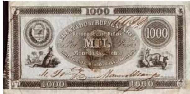
1.000 Pesos Moneda Corriente Emisor: El Estado de Buenos Ayres Anverso: Llama derecha, y escudo y canguro a la izquierda Año: 1856