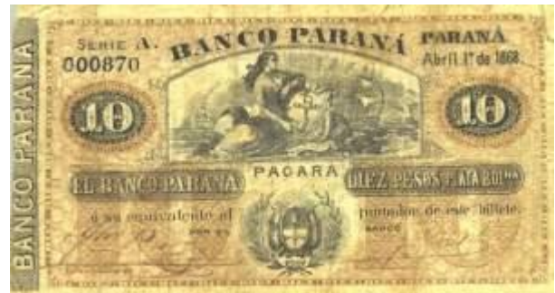
10 Pesos Plata Boliviana Emisor: Banco Paraná Anverso: Año: 1868