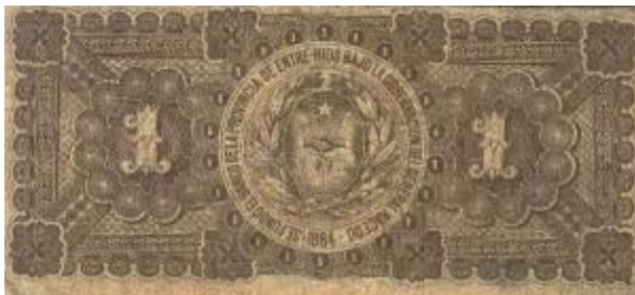
1 Peso Moneda Nacional Oro Emisor: Banco Provincial de Entre Ríos Anverso: Eduardo Racedo Reverso: Escudo provincial Año: 1885