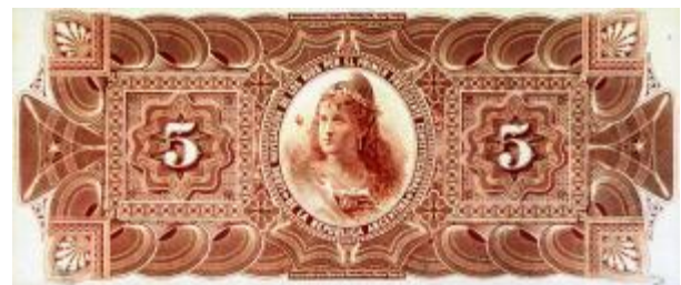
5 Pesos Moneda Nacional Oro Emisor: Banco Provincial de Entre Ríos Anverso: Justo José de Urquiza Reverso: Escudo provincial Año: 1885