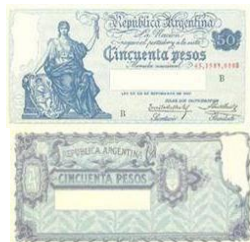
50 Pesos Tamaño: 173 x 84 mm Anverso: Efigie del Progreso Reverso: Escudo Nacional Vigencia: 1899-1935