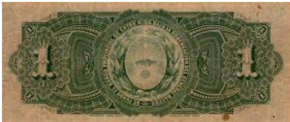
1 Peso Moneda Nacional Oro Emisor: Banco Provincial de Entre Ríos Anverso: Eduardo Racedo Reverso: Escudo provincial Año: 1885