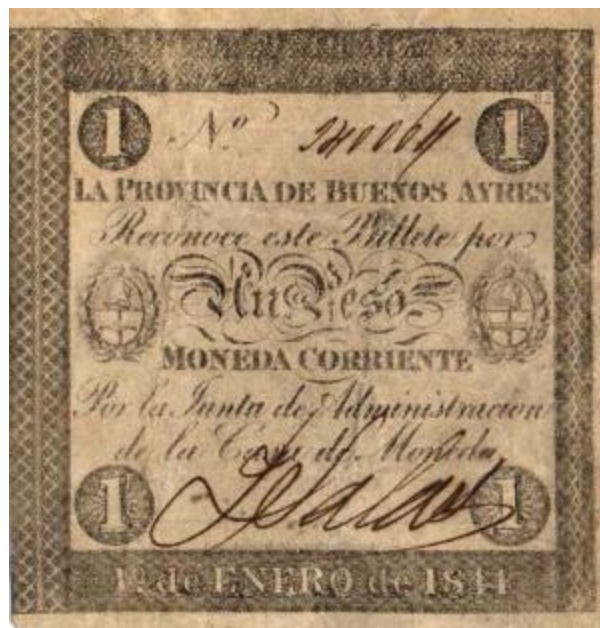
1 Peso Moneda Corriente Emisor: Provincia de Buenos Ayres

Durante la presidencia de Justo José de Urquiza (31/5/1852 - 5/3/1860) se emitieron los siguientes billetes en el año 1854. Esta emisión se caracteriza por excluir de los billetes la leyenda política: "Viva la confederación Argentina... Mueran los Salvajes Unitarios".