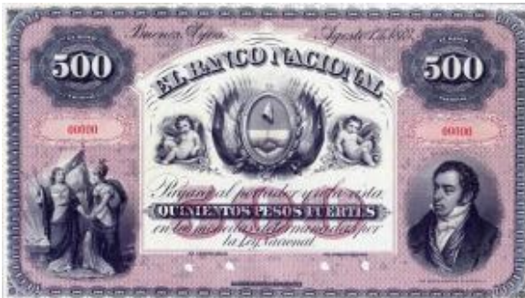
500 Pesos Fuertes Emisor: Banco Nacional Anverso: Bernardino Rivadavia Año: 1873