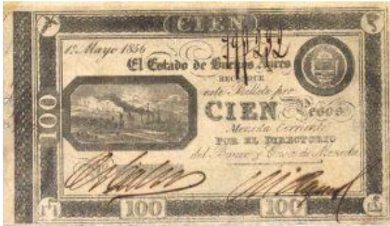
100 Pesos Moneda Corriente Emisor: El Estado de Buenos Ayres Anverso: Año: 1856