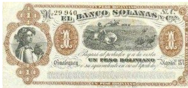
1 Peso Boliviano Emisor: Banco Solanas (Gualeguay) Anverso: Gaucho y avestruces Año: 1874