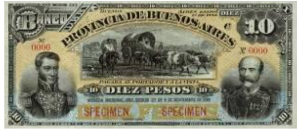
10 Pesos Moneda Nacional Oro Emisor: Banco de la Provincia de Buenos Aires Anverso: General J. A. de Arenales (izquierda) y General Juan G. Las Heras (derecha) Reverso: Valor en números Año: 1885