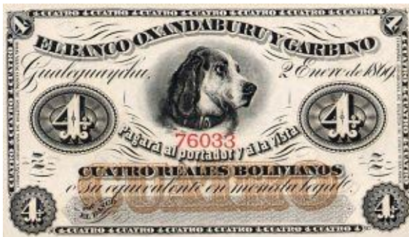
4 Reales Bolivianos Emisor: Banco Oxandaburu y Garbino (Gualaguaychu) Anverso: Perro Año: 1869