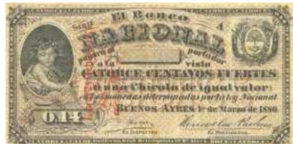
14 Centavos Fuertes Emisor: Banco Nacional Anverso: Año: 1879