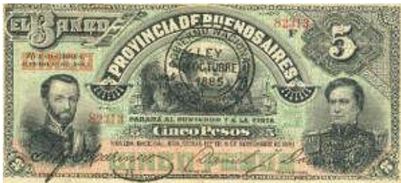
5 Pesos Moneda Nacional Oro Emisor: Banco de la Provincia de Buenos Aires Anverso: General Lavalle (izquierda) y José María Paz (derecha) Reverso: Valor en números Año: 1885