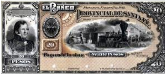
20 Pesos Moneda Nacional Emisor: Banco Provincial de Santa Fe Anverso: Estanislao Lopez Reverso: Valor en números Año: 1882