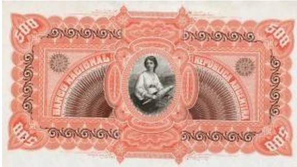
500 Pesos Moneda Nacional Oro Emisor: Banco Nacional Anverso: General José de San Martín Reverso: Mujer. Valor en números Año: 1883