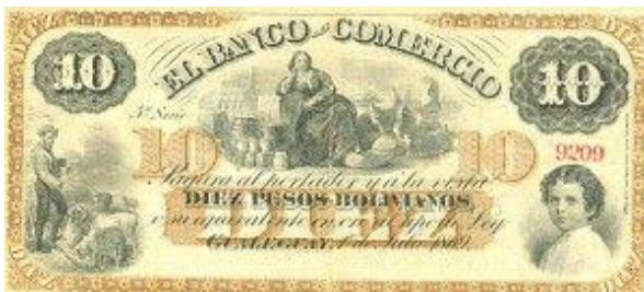
10 Pesos Bolivianos Emisor: Banco de Comercio (Gualeguay) Anverso: Año: 1869