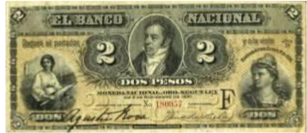
2 Pesos Moneda Nacional Oro Emisor: Banco Nacional Anverso: Bernardino Rivadavia Reverso: Valor en números Año: 1883