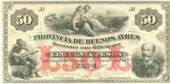
50 Pesos Moneda Corriente Emisor: Banco de la Provincia de Buenos Ayres Anverso: General Juan Gregorio Las Heras Año: 1869