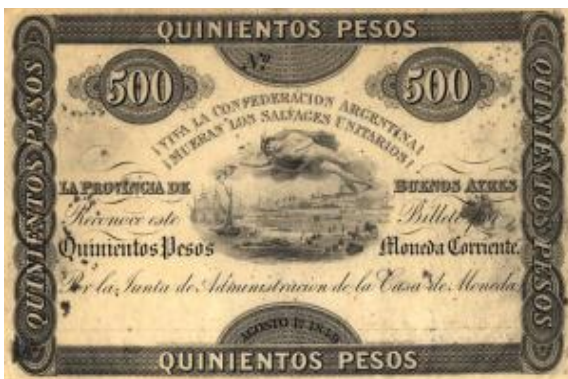
500 Pesos Moneda Corriente Emisor: Casa de Moneda de la Provincia de Buenos Ayres Leyenda: "Viva la Confederacion Argentina... Mueran los Salvajes Unitarios" Anverso: Año: 1849