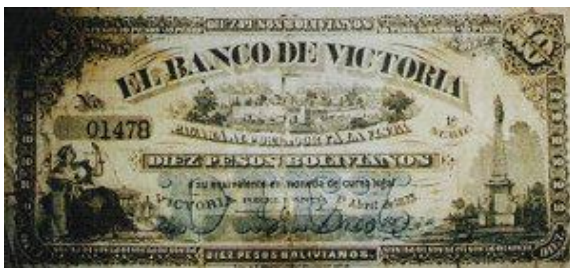
10 Pesos Bolivianos Emisor: Banco de Victoria (Entre Ríos) Anverso: Pirámide de Mayo Año: 1873