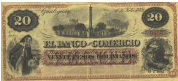
20 Pesos Bolivianos Emisor: Banco de Comercio (Gualeguay) Anverso: Año: 1869