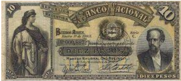
10 Pesos Moneda Nacional Oro Emisor: Banco Nacional Anverso: Julio Argentino Roca Reverso: Valor en números Año: 1883