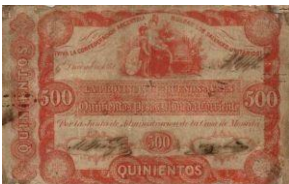
500 Pesos Moneda Corriente Emisor: Casa de Moneda de la Provincia de Buenos Ayres Leyenda: "Viva la Confederacion Argentina... Mueran los Salvajes Unitarios" Anverso: Mujer y niños Año: 1851