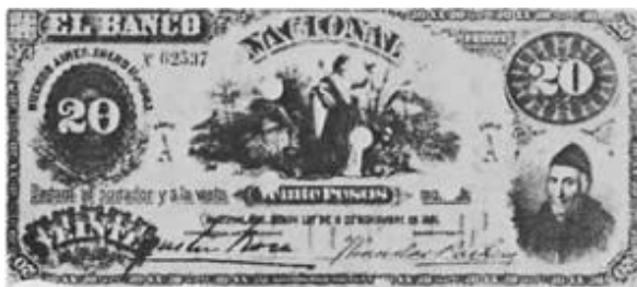
20 Pesos Moneda Nacional Oro Emisor: Banco Nacional Anverso: Dean Gregorio Funes Reverso: Año: 1883