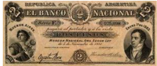
2 Pesos Moneda Nacional Oro Emisor: Banco Nacional Anverso: Bernardino Rivadavia Reverso: Año: 1883