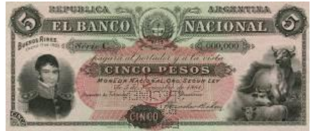
5 Pesos Moneda Nacional Oro Emisor: Banco Nacional Anverso: Nicolás Rodríguez Peña Reverso: Año: 1883