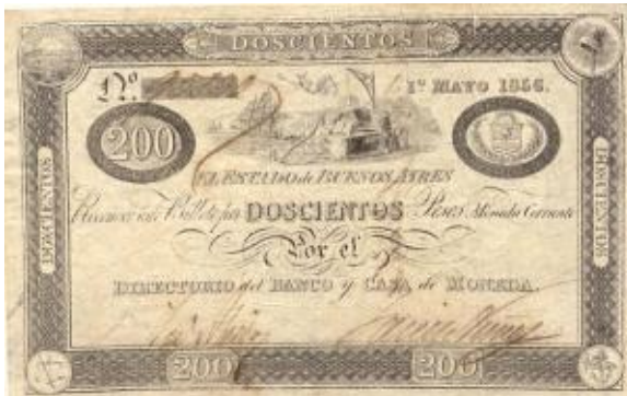
200 Pesos Moneda Corriente Emisor: El Estado de Buenos Ayres Anverso: Puerto, barco Año: 1856