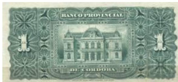
1 Peso Moneda Nacional Emisor: Banco Provincial de Córdoba Anverso: Miguel Juárez Celman Reverso: Edificio Año: 1889