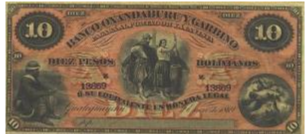
10 Pesos Bolivianos Emisor: Banco Oxandaburu y Garbino (Gualaguaychu) Anverso: Gauchos Año: 1869