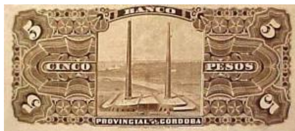
5 Pesos Moneda Nacional Emisor: Banco Provincial de Córdoba Anverso: Dalmacio Velez Sarsfield Reverso: Pilares Año: 1889