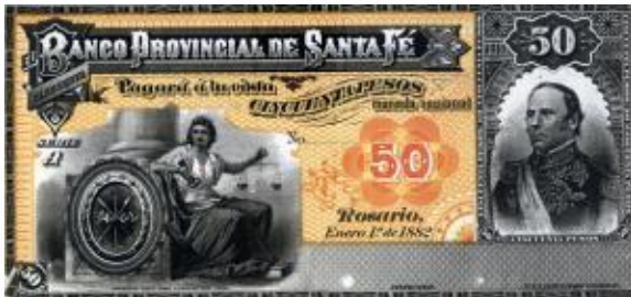
50 Pesos Moneda Nacional Emisor: Banco Provincial de Santa Fe Anverso: Justo José de Urquiza Reverso: Valor en números Año: 1882