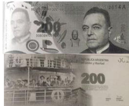
200 Pesos Anverso: Hipólito Yrigoyen Reverso: Barco