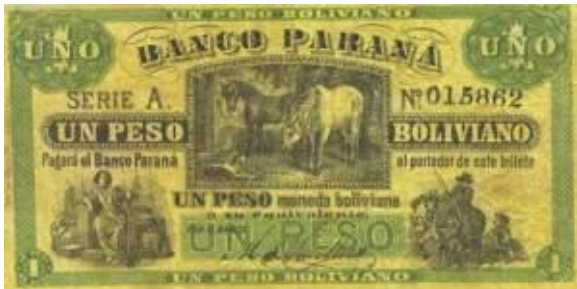
1 Peso Moneda Boliviana Emisor: Banco Paraná Anverso: Caballos Año: 1868