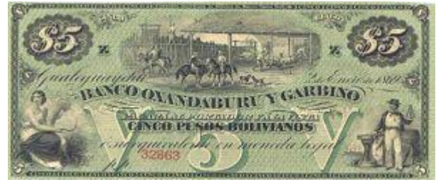
5 Pesos Bolivianos Emisor: Banco Oxandaburu y Garbino (Gualaguaychu) Anverso: Hombre a caballo Año: 1869