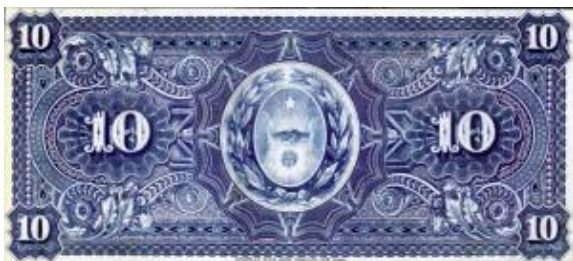
10 Pesos Moneda Nacional Oro Emisor: Banco Provincial de Entre Ríos Anverso: León Sola Reverso: Escudo provincial Año: 1885