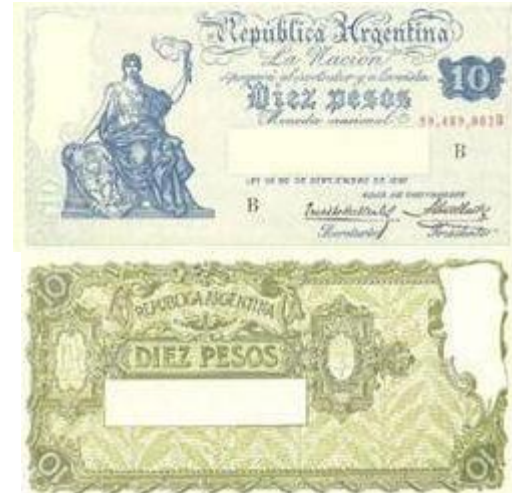
10 Pesos Tamaño: 158 x 77 mm Anverso: Efigie del Progreso Reverso: Escudo Nacional Vigencia: 1899-1935