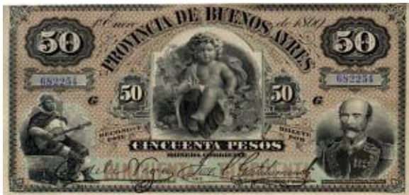
50 Pesos Moneda Corriente Emisor: Banco de la Provincia de Buenos Ayres Anverso: General Juan Gregorio Las Heras Año: 1869