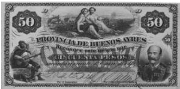
50 Pesos Moneda Corriente Emisor: Banco de la Provincia de Buenos Ayres Anverso: General Juan Gregorio Las Heras Año: 1869