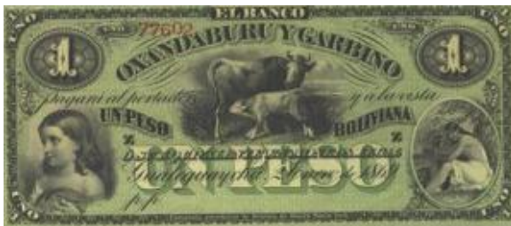
1 Peso Bolivianos Emisor: Banco Oxandaburu y Garbino (Gualaguaychu) Anverso: La vaca y el ternero Año: 1869