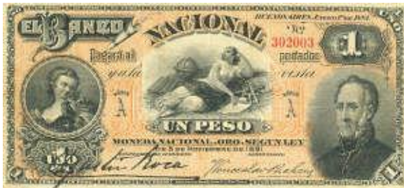
1 Peso Moneda Nacional Oro Emisor: Banco Nacional Anverso: Gral. Martín Rodríguez Peña Reverso: Valor en números Año: 1883