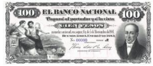
100 Pesos Moneda Nacional Oro Emisor: Banco Nacional Anverso: Juan José Paso Reverso: Año: 1883