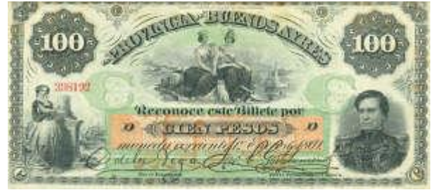
100 Pesos Moneda Corriente Emisor: Banco de la Provincia de Buenos Ayres Anverso: General José María Paz Año: 1869