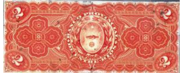
2 Pesos Moneda Nacional Oro Emisor: Banco Provincial de Entre Ríos Anverso: Antonio Crespo Reverso: Escudo provincial Año: 1885