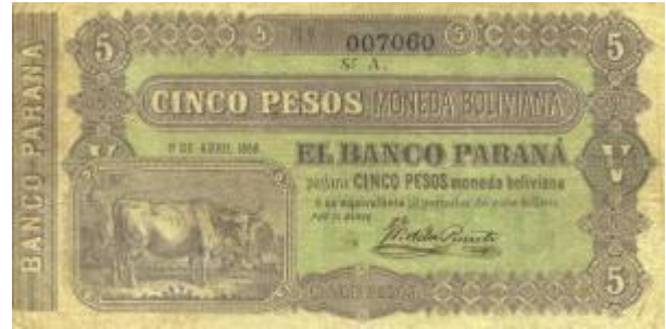
5 Pesos Moneda Boliviana Emisor: Banco Paraná Anverso: Vaca Año: 1868