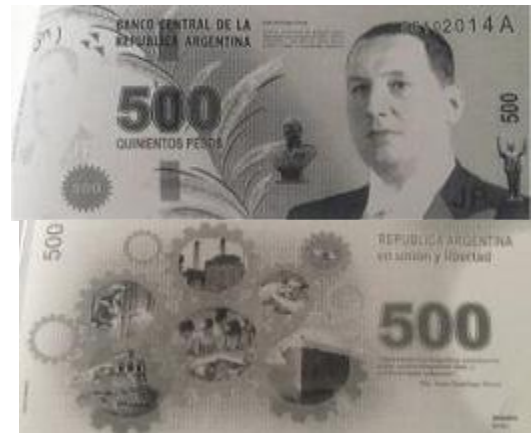
500 Pesos Anverso: Juan Domingo Perón Reverso: Alegorías del trabajo