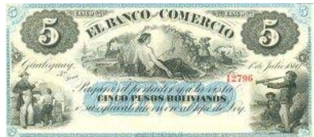
5 Pesos Bolivianos Emisor: Banco de Comercio (Gualaguaychu) Anverso: Año: 1869