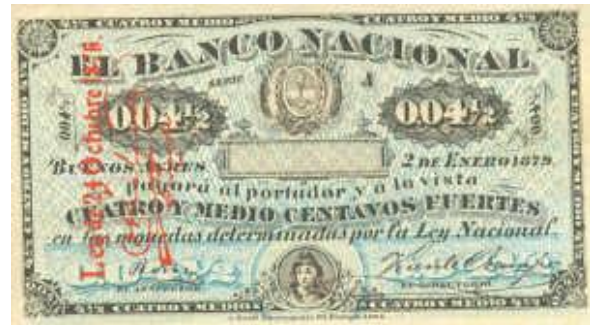
4 y medio Centavos Fuertes Emisor: Banco Nacional Anverso: Año: 1879