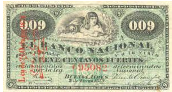
9 Centavos Fuertes Emisor: Banco Nacional Anverso: Niña y perro Año: 1879