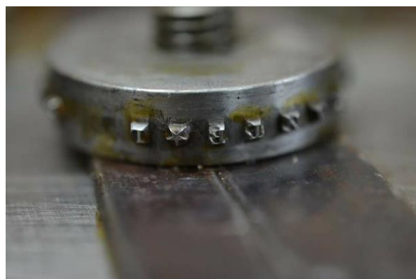
Matriz utilizada para el canto