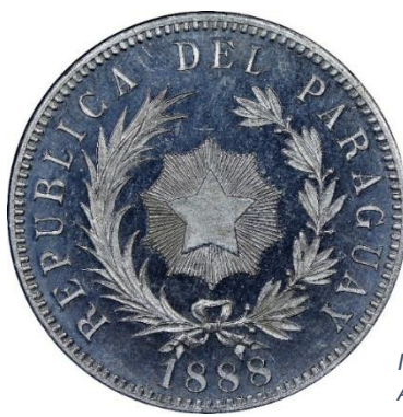
IMÁGENES NGC - PRUEBA EN ALUMINIO 1888