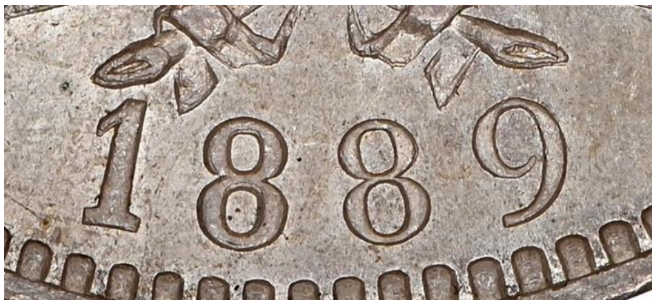
9 CERRADO IMAGEN NGC