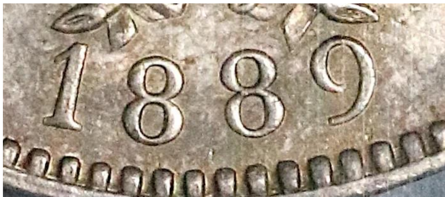
9 ABIERTO NGC