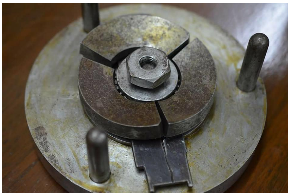
Matriz utilizada para la elaboración del canto parlante de la moneda.