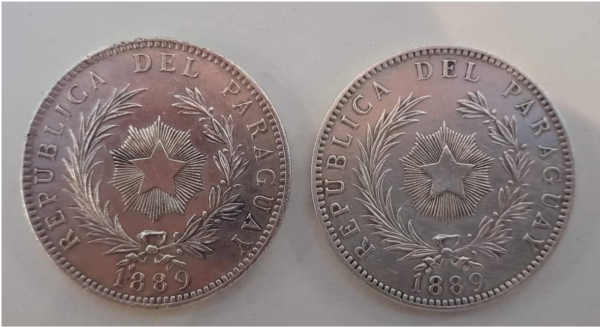
COLECCIÓN MAHONRI ESPINOLA