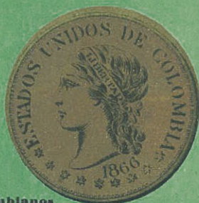
20 Pesos colombianos Valor $ 18,66