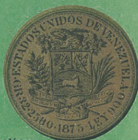
20 Pesos ó 100 bolivares Valor $ 18,66