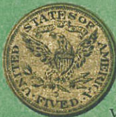
1/2 águila Valor $ 4,88