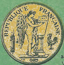
50 Francos Valor $ 9,33