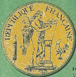
100 Francos Valor $ 18,66