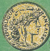
20 Francos Valor $ 3,73