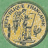
20 Francos Valor $ 3,73