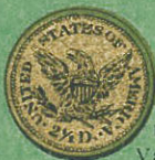
1/4 águila Valor $ 2,41