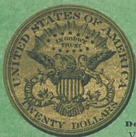
Doble águila Valor $ 19,32