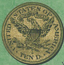
Águila Valor $ 9,66