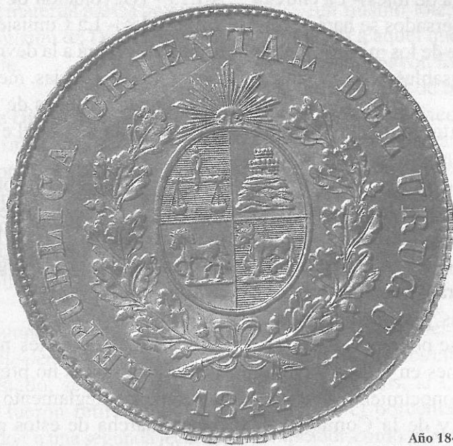
Año 1844 Valor 1 Peso Fuerte Acuñado en la Casa de Moneda Nacional Se acuñaron 1226 monedas.