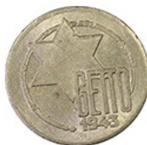
5 Mark 1943 - Aluminio - 1.57 g - 22.5 mm