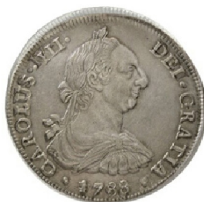
Potosí 1788 vs 1790