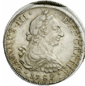
1790 Potosí Vs 1789 Lima