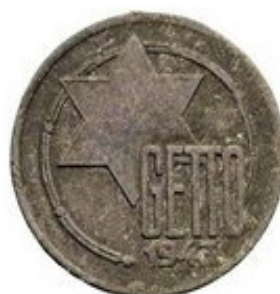
5 Mark 1943 - Aluminio - Magnesio - 1.57 g - 22.5 mm