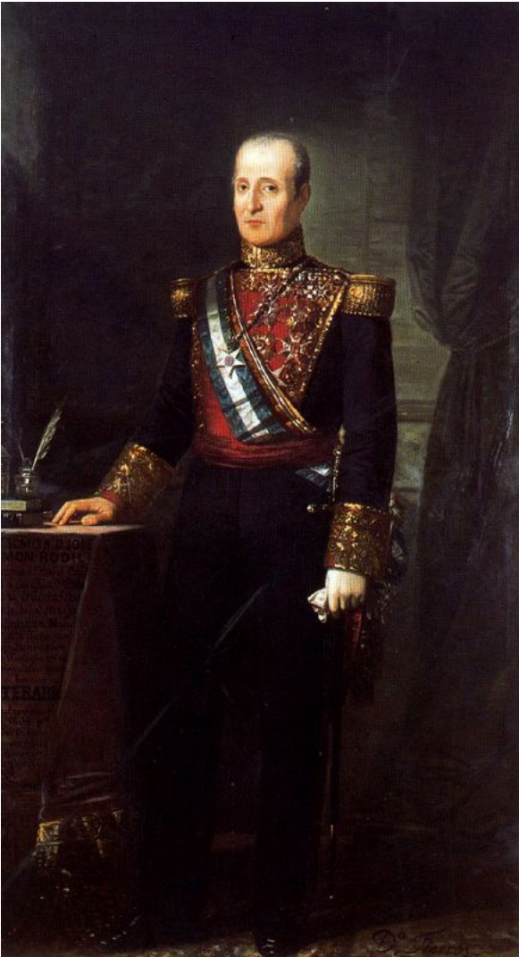
Retrato del militar y político español José Ramón Rodil y Campillo realizado por el pintor Dionisio Fierros

E l 29 de febrero de 1824, el ejército español bajo el mando del General José Ramón Rodil y Campillo, retoma el control de la ciudad de Lima, tras la evacuación de las tropas patrióticas comandadas por el General Mariano Necochea, quién recibe órdenes de Bolívar de retirarse.