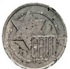
10 Mark 1943 - Aluminio - Magnesio - 1.75 g - 28,4 mm