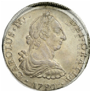
1790 Potosí Vs Guatemala