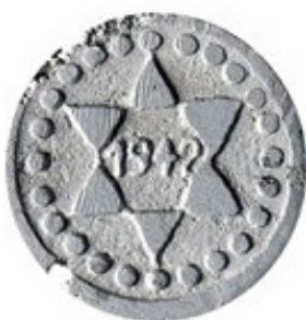
5 Pfennig 1942 - Aluminio - 1.21 g - 19 mm