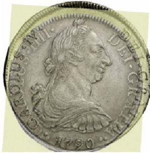
1790 Potosí Vs México

Se analizarán imágenes entre las diferentes cecas, o sea en esta oportunidad si se mezclaran imágenes de diferentes lugares (por ej. se compararán imágenes de un 8 reales de México 1790 con otro 8 reales 1790 Potosí, ambos de transición).