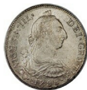
Lima 1788 vs 1789