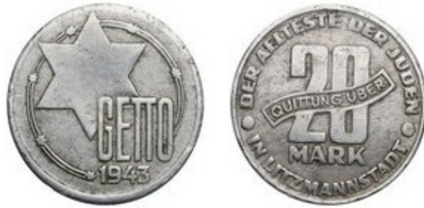
20 Mark 1943 - Aluminio - 6.98 g - 33.45 mm