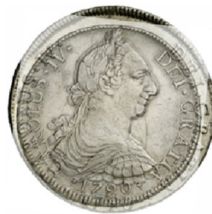
1790 Potosí Vs Chile

Como conclusión de la 2da presunción, se observa que tampoco hay diferencias notorias en los diseños utilizados en los bustos.