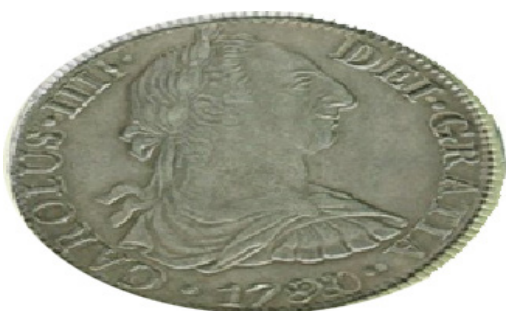
México 1788 vs 1790

Se toma una imagen del diseño anterior al fallecimiento de Carlos III y se lo compara con el de un busto de transición, siempre respetando misma ceca y mismo ensayador (por ej. se comparará una imagen de un 8 reales de México 1788 con otra de la misma ceca pero 1790, o sea de transición).