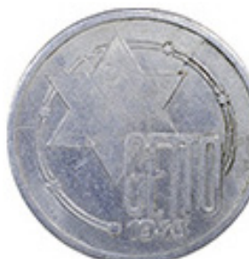
10 Mark 1943 - Aluminio - 3.40 g - 28,3 mm