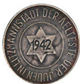
10 Pfennig 1942 - Aluminio - Magnesio - 0.76 g - 19,1 mm