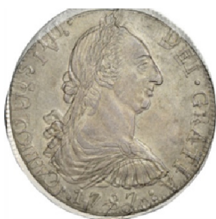
Guatemala 1787 vs 1790