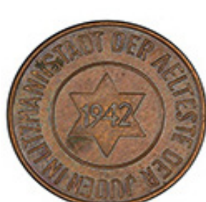
10 Pfennig 1942 - Bronce - 0.76 g - 19,1 mm