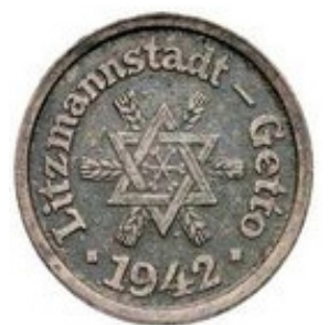
10 Pfennig 1942 - Aluminio - Magnesio 0.90 g - 21 mm Este diseño fue destruido en su mayoría por su parecido a la moneda Alemana.