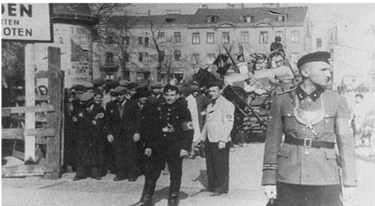
Policías custodiando el gueto

El gueto de la ciudad polaca de Łódź (nombre de ocupación alemán, Litzmannstadt), creado en febrero de 1940 fue el primero en ser construido y el último en ser clausurado y se convirtió en el segundo más grande en la ocupación de la Alemania Nazi durante la Segunda Guerra Mundial.