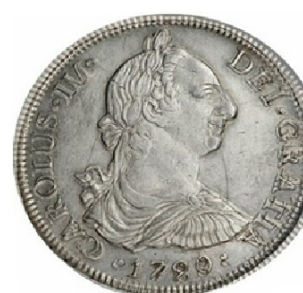
Chile 1788 vs 1790