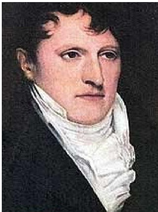
Fig. 2 - Retrato de Carbonier de 1815

La pintura de Boichard, pese a su calidad y valor iconográfico, lamentablemente no ha sido aprovechada para su difusión en la medalla. Existe además otra miniatura, en la que se muestra muy parcialmente el rostro del prócer, y que dejamos de lado ya que no aporta al tema tratado.