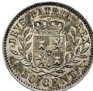
50 Céntimos 1876 - AR - Mint.Bruselas - 17.mm. - 2.50 grs.