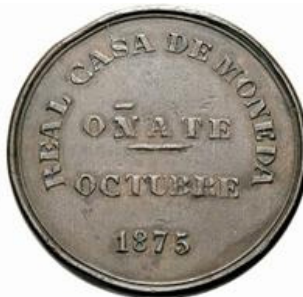
Medalla conmemorativa por la inauguración por Carlos VII en octubre de 1875 de la Real Casa de Monedas de Oñate. - AR - Conocida como duro de Oñate