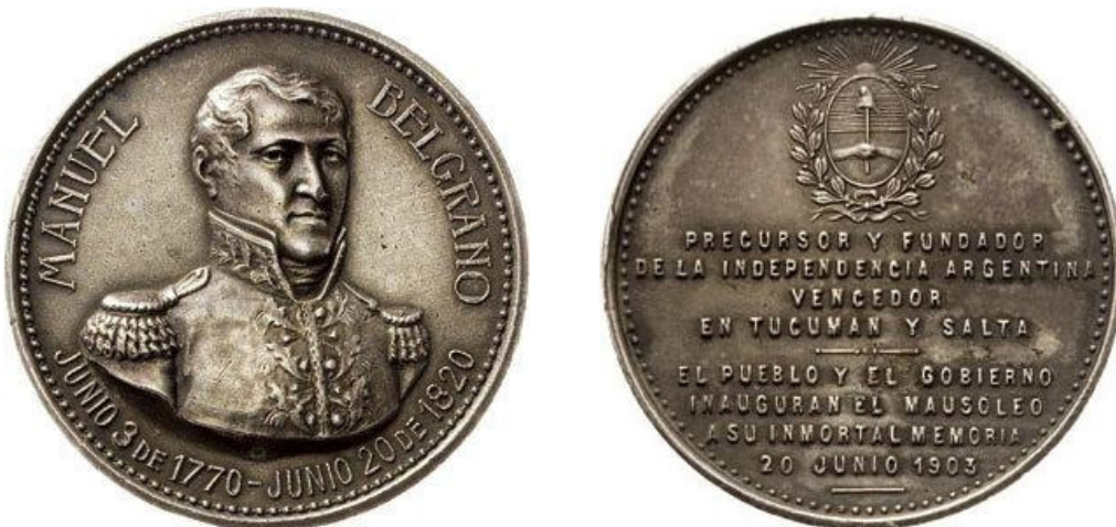
Fig. 11 - Grabado de Gottuzzo, 1903

El grabado es de muy buena factura y se hizo por la casa Gottuzzo, en un módulo de 65 milímetros y en varios metales, agregándose además a ésta, una edición en módulo de 38,2 milímetros, que llevan por su reverso el escudo nacional y una leyenda.