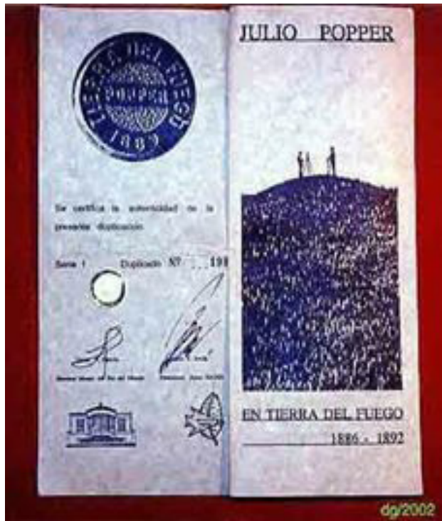
Certificado duplicado Serie 1 Nro. 198