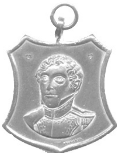
Fig. 9 - Serie del 9 de Julio

Por la misma casa grabadora, en 1897, se hicieron una serie de medallas de igual formato (escudada) y módulo, conmemorativas del 9 de Julio. Entre ellas se reutilizó el tan bien logrado cuño con el retrato de Baclé (Fig. 9). Y aunque siendo ahora de un módulo menor, tuvo su compensación ya que en el campo sólo se grabó la figura de Belgrano, sin leyendas.