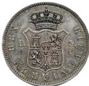
5 Pesetas 1874 - AR - Mint Bruselas - Canto liso -