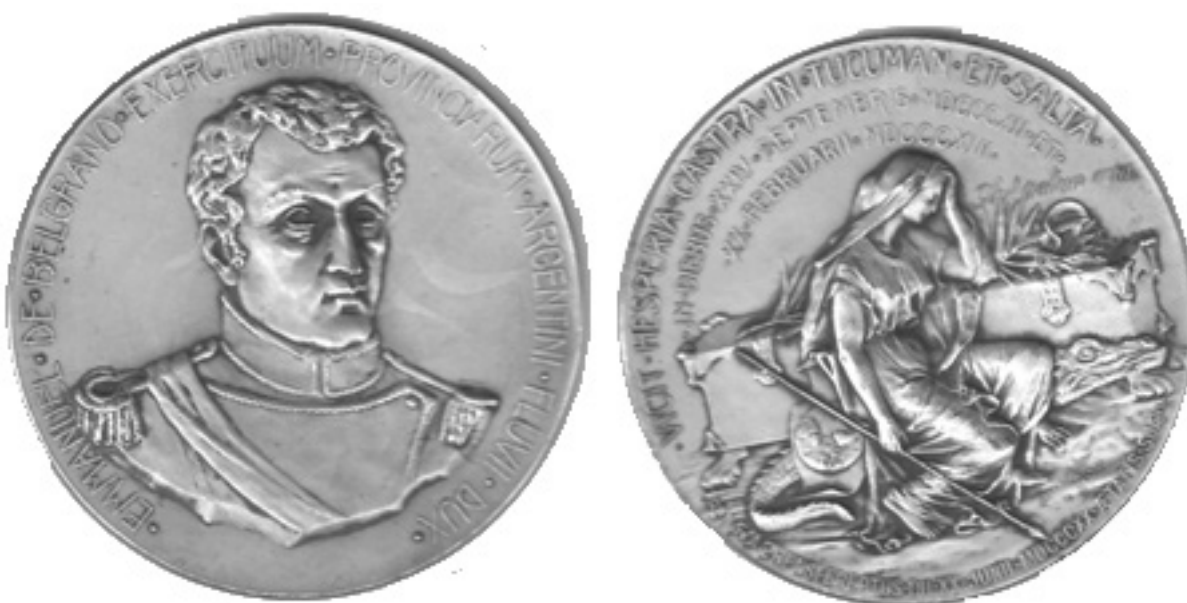
Fig. 11 - Retrato tomado de Núñez de Ibarra

Digamos también, de paso, que la figura de Belgrano tiene además mucho parecido con el retrato (que ampliamos) de Géricault Fig. 4.