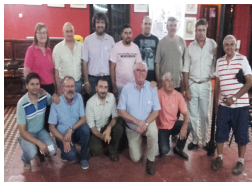
Parte de los integrantes del Centro Numismático Venado Tuerto