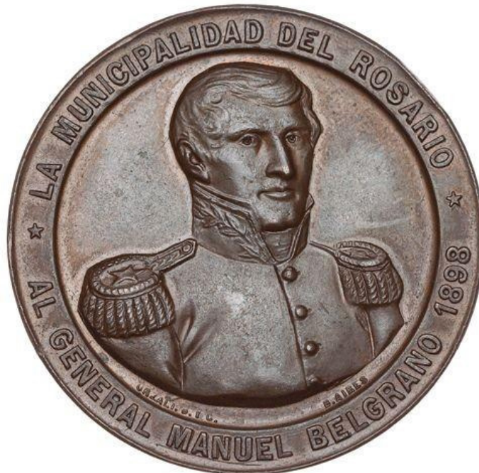
Fig. 10 - La Municipalidad de Rosario . 1898

En 1898, la Municipalidad de Rosario, en conmemoración de la creación de la Bandera ordena la edición una medalla de 46 mm de módulo, donde, en el anverso, se muestra la figura de Belgrano tomada del óleo de Carbonier, pero vestido con su traje militar, siguiendo la idea iniciada por Baclé (Fig. 10). Este cuño, con el rostro bien logrado respecto al óleo tomado por modelo, será reutilizado varias veces, como veremos más adelante.