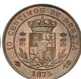
10 Céntimos 1875 - Cu - Mint.Bruselas - 30 mm - 10.5 grs.