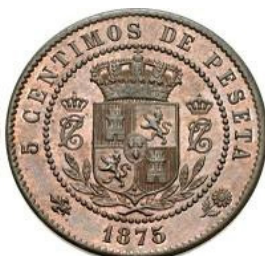
5 Céntimos 1875 - Cu - Mint.Bruselas - 25 mm. - 5,21 grs.