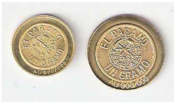
Certificado duplicado Serie 1 nro. 079