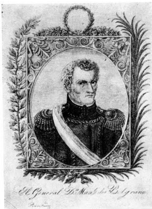
GENERAL MANUEL BELGRANO Grabado de José Rousseau sobre dibujo de Núñez de Ibarra (1821) Museo Histórico Nacional

b) El grabado hecho en Buenos Aires por Manuel Pablo Núñez de Ibarra, del que hay dos versiones, muy similares: la de 1818 (Fig. 6) y la de 1819.