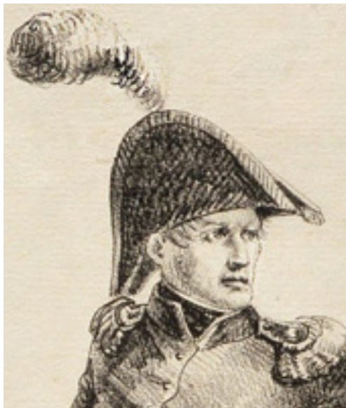
Fig. 5 - Ampliación del rostro

b) El grabado hecho en Buenos Aires por Manuel Pablo Núñez de Ibarra, del que hay dos versiones, muy similares: la de 1818 (Fig. 6) y la de 1819.