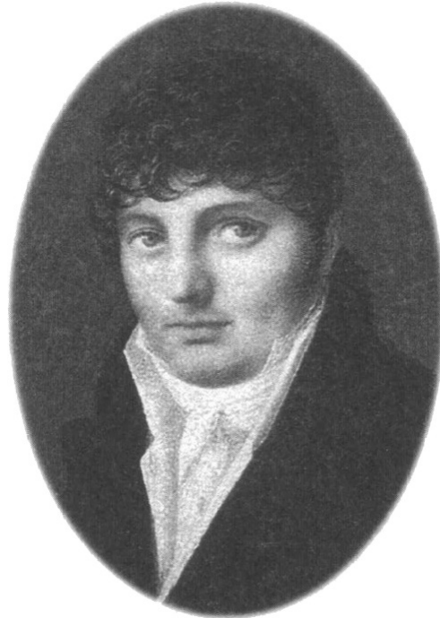
Fig. 1 - Miniatura firmada por Boicard