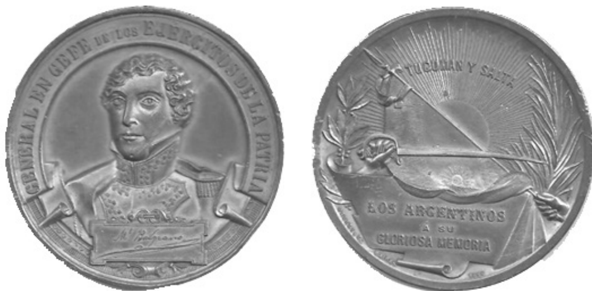
Fig. 8 - Grabado de Orzalli de 1896

El retrato de 1896, que se labra en el anverso de una medalla a su “gloriosa memoria” por sus triunfos en Tucumán y Salta y que nos muestra su rostro tomado evidentemente del dibujo de Andrea Baclé de 1829. Esta reproducción medallística fue conseguida con gran perfección por el grabador Orzalli, como puede comprobarse por su mención de éste en el metal. Por su reverso, lleva una composición con bandera y espada sobre sol radiante, colocados entre adornos de laurel y palma. Aunque se trata de un retrato derivado, lo consideramos de gran valor por su esmerada factura respecto al ícono de referencia. Se hizo en un módulo de 57 milímetros y en los metales: plata, cobre, cobre dorado y cobre plateado.