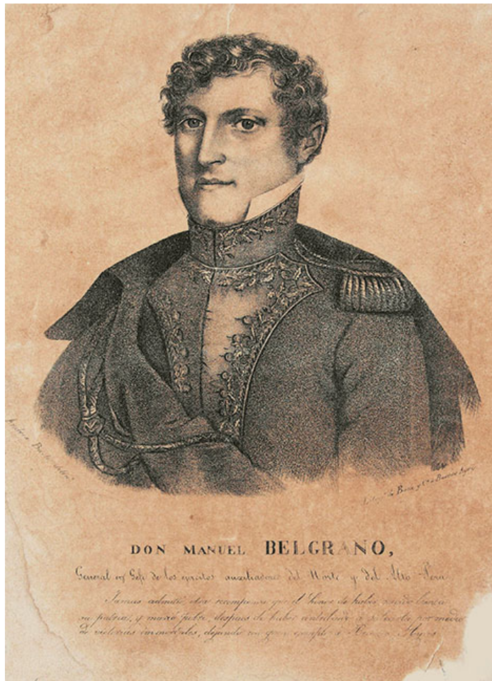
Fig. 7 - Litografía de Andrea Baclé de 1829 Museo Histórico Cornelio Saavedra

a) El dibujo de Andrea Baclé de 1829, hecho para la serie conocida como de “próceres argentinos”, que deriva del óleo de Goulú de 1818, -a espejo- al que le fue agregado el uniforme militar y la capa, dejándole, incorrectamente, el cuello de la camisa de civil.