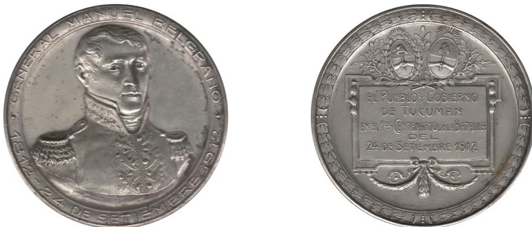
Fig. 12 - Centenario de la Victoria de Tucumán. 1912

Para 1912, celebrando el Centenario de la victoria de Tucumán, se hacen gran cantidad de piezas. Entre las primeras, conteniendo el retrato de Belgrano, tenemos la mandada acuñar por el Gobierno de Tucumán (Fig. 12), con un módulo de 60 milímetros, en cobre dorado y cobre plateado. Todas hechas por Gottuzzo con el mismo plato escultórico partiendo del óleo de Carbonier con traje militar, pero en el cuello, ropa civil.