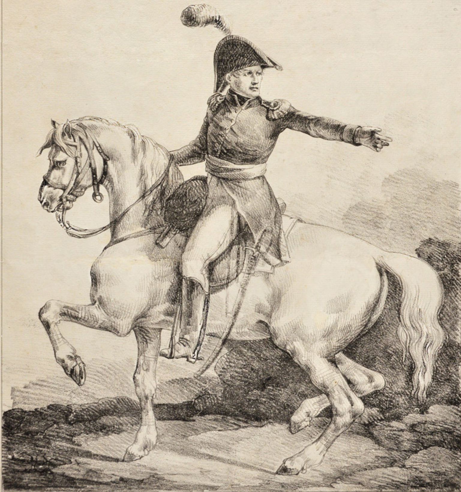
D no Manuel Belgrano. General en Jefe del exercito auxiliar del peru.