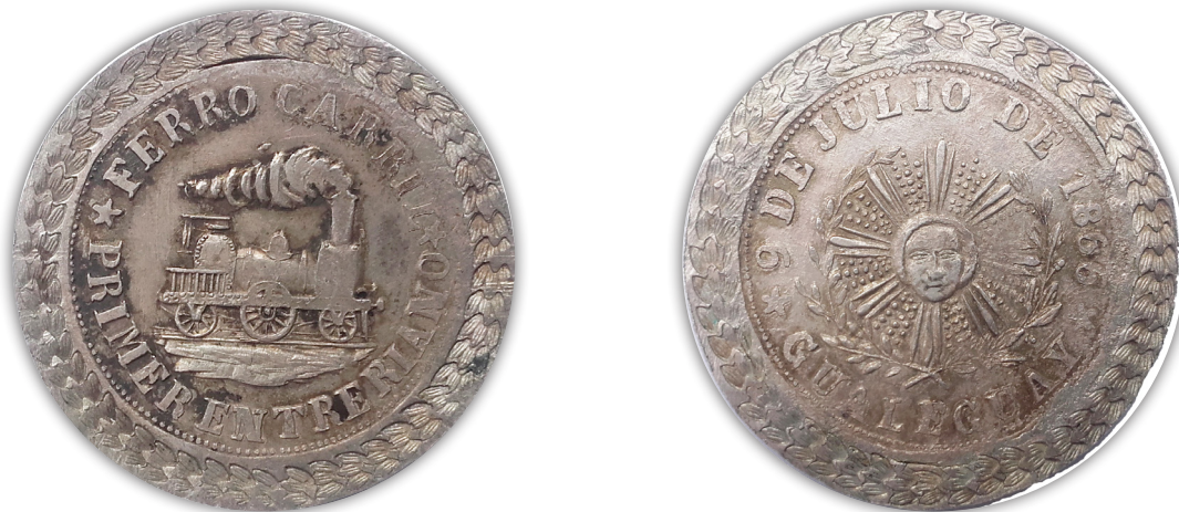
Pieza perteneciente a un asociado del Centro Numismático Santa Fe

Anverso: Igual al anterior. Lleva una orla laureada de 8 mm. Se puede apreciar que la misma ha sido agregada posteriormente y la finura de la plata es diferente al resto de la medalla.