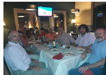
Culminación de la Jornada con una cena de camaradería