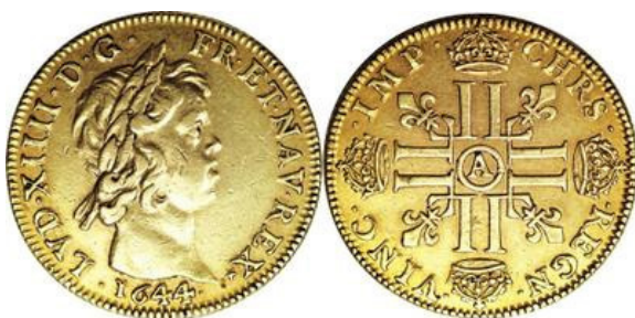
Cuadruple Luis de oro - 1644 -