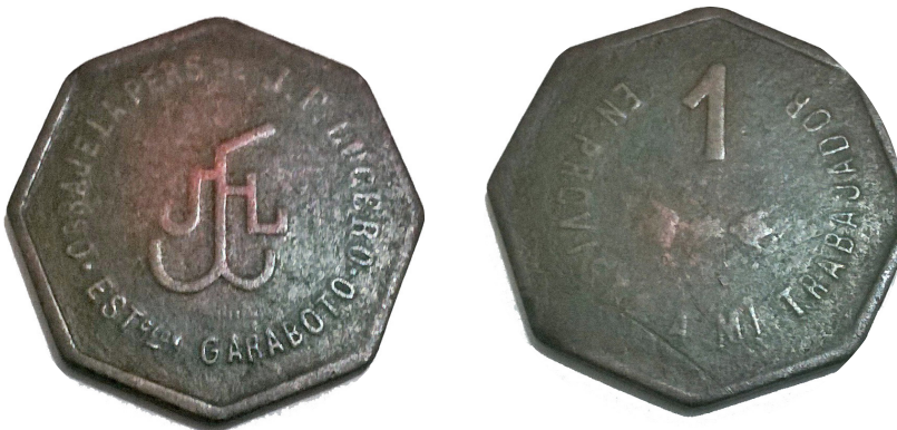
Peso: 7.8 g - modulo: 30 mm (octogonal) canto: Liso- espesor: 1,5 mm aclaro esta es mas pesada que la anterior por su mayor espesor.