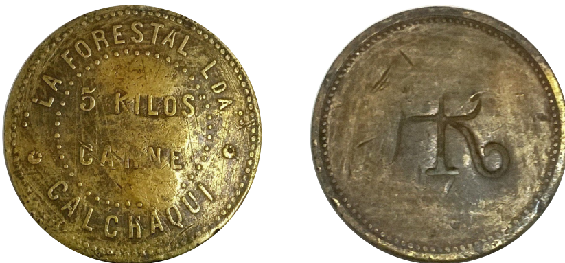
(a) Peso: 10,3 g - modulo: 33 mm - metal: Bronce - canto: Liso - reverso: Marca HR

Según he consultado con otros coleccionistas esta Ficha es poco vista, como podemos apreciar la misma lleva en su reverso idéntica marca (HR) que se ven en las Fichas de Calchaquí (a), iniciales que se presuponen pertenecen a Harteneck y Renner (1). Una incógnita a descifrar es saber si está Ficha fue usada en la Localidad de Arrufó Departamento San Cristóbal, Sta. Fe .