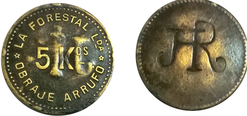
Peso: 7,3 g - modulo: 30 mm - canto: Liso - metal: Bronce - reverso : Marca HR

Según he consultado con otros coleccionistas esta Ficha es poco vista, como podemos apreciar la misma lleva en su reverso idéntica marca (HR) que se ven en las Fichas de Calchaquí (a), iniciales que se presuponen pertenecen a Harteneck y Renner (1). Una incógnita a descifrar es saber si está Ficha fue usada en la Localidad de Arrufó Departamento San Cristóbal, Sta. Fe .