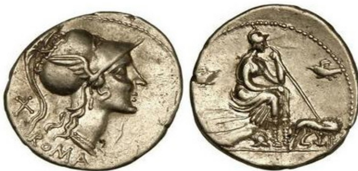
Denario Anónimo 115-114 a.C

La pureza de los denarios de Augusto era del 96 a 98 % de plata, pero comenzó a descender la ley y peso a partir de Nerón. Las fluctuaciones y las reformas monetarias fueron continuas durante el Imperio. Tras Gordiano III (siglo III d.C), el denario, cuya pureza había disminuido hasta un 5%, dejó de emitirse, siendo sustituido por el antoniniano introducido tiempo atrás por Caracalla (Marco Aurelio Antonino)