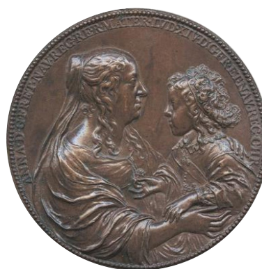
Medalla de bronce - Luis XIV y su madre Ana de Austria 1645