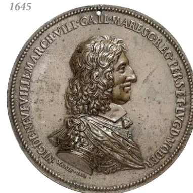
Medalla de bronce - Nicolas de Neufville, Marques de Villeroy. - 1651 103mm, 155.35 g