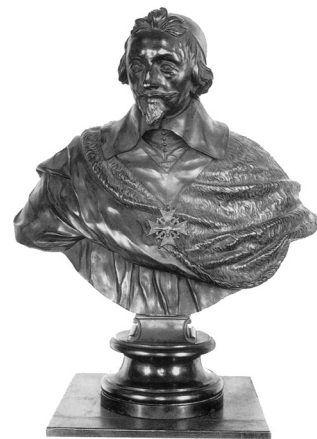
Busto de Richelieu Warin - c 1640 Biblioteca Mazarini - París