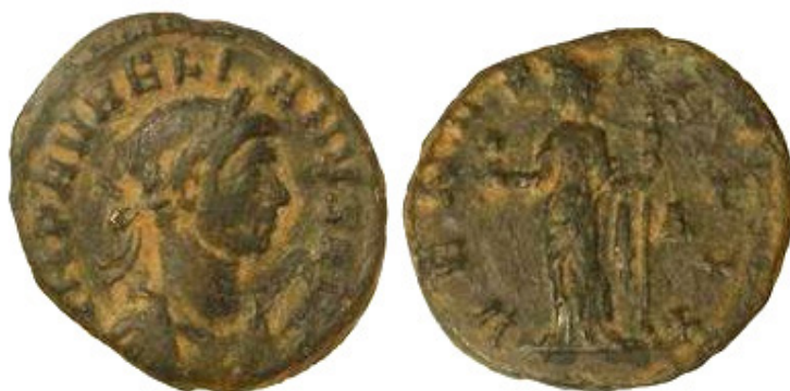
Denario de cobre - 270-275 d.C. AURELIANO