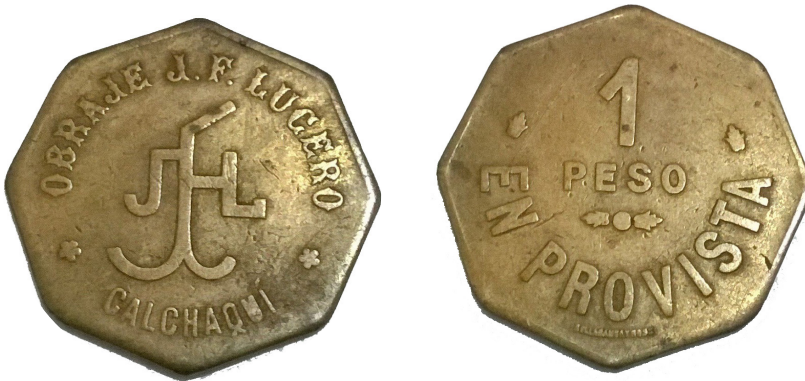
RARA. Peso: 5,5 g - modulo: 30 mm (octogonal) canto: Liso - espesor: 1 mm - metal: Bronce - acuñador: Bellagamba y Rossi