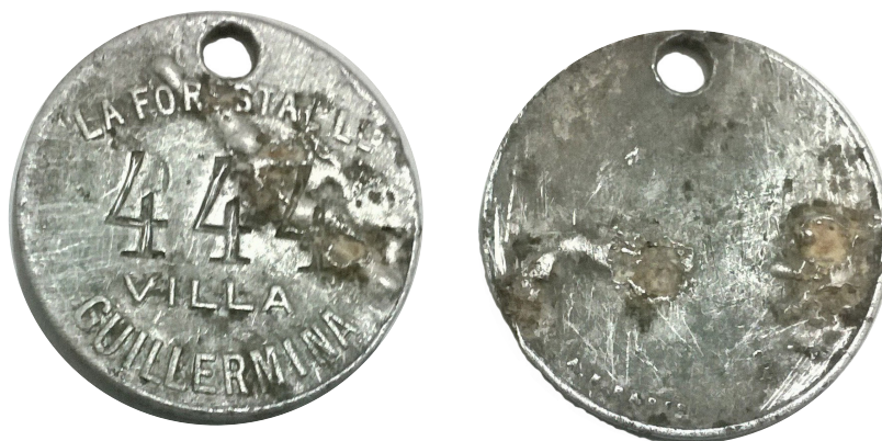
"LA FORESTAL" LTD VILLA GUILLERMINA

Peso: 27 g - modulo: 30 mm- metal: Al - canto: Liso - reverso: Liso - acuñador: A.N.Bares