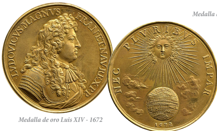
Medalla de oro Luis XIV - 1672