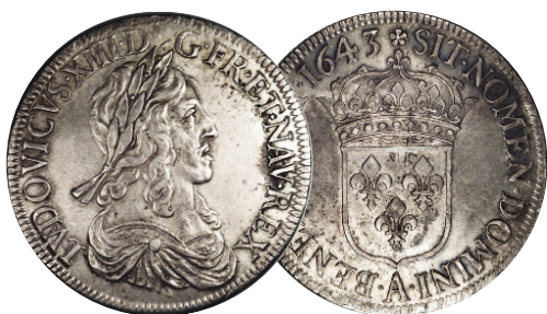
1 Ecu - Luis XIII - 1643 - Plata - 27,45 g