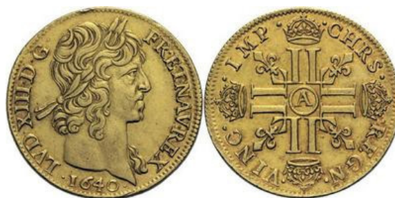
Doble Luis de oro - 1640 - 13,59 grs.