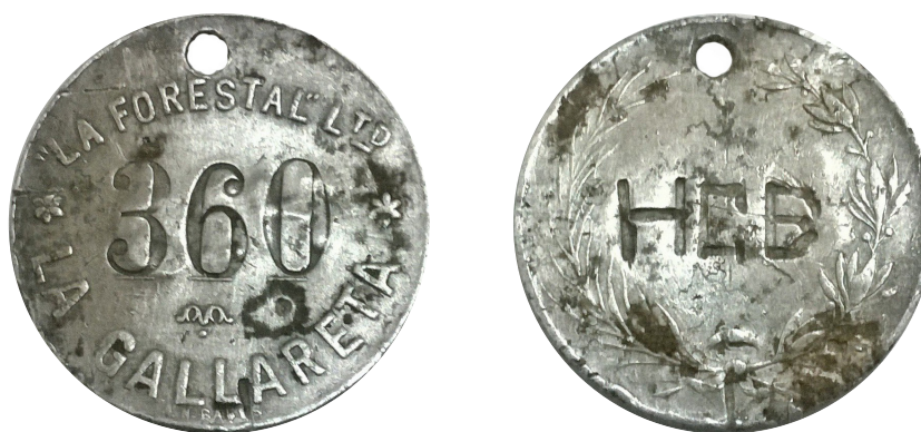
"LA FORESTAL" LDA - LA GALLARETA

Peso: 27 g - modulo: 30 mm- metal: Al - canto: Liso - reverso: Liso - acuñador: A.N.Bares