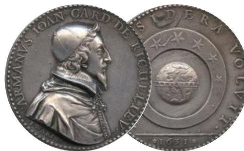
Medalla de plata - Armand -Jean Duplessis, Cardenal Ri- chelieu - 1631 - 50,5 mm.