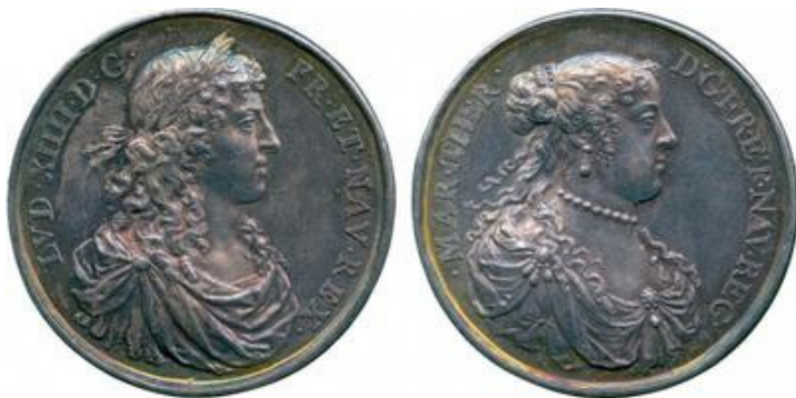
Medalla de plata - Luis XIV y María Teresa de España - 1660