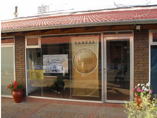
Frente de la nueva sede del Centro Numismático Santa Fe

Un viejo anhelo del Centro pudo ser concretado con la inauguración de su sede social, ubicado en la Galería Macarena, local 18, en Peatonal San Martín Norte 2900.