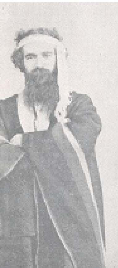
Orélie Antoine de Tounens con vestido tradicional mapuche.