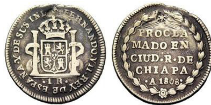
Cayón - Subasta 24/09/2014 Lote 195

Rev.: Inscripción en cinco líneas, dentro de una corona de laurel: PROCLA / MADO EN / CIUD . R . DE / CHIAPA / . A 1808 . Encima de la inscripción una estrella radiante.