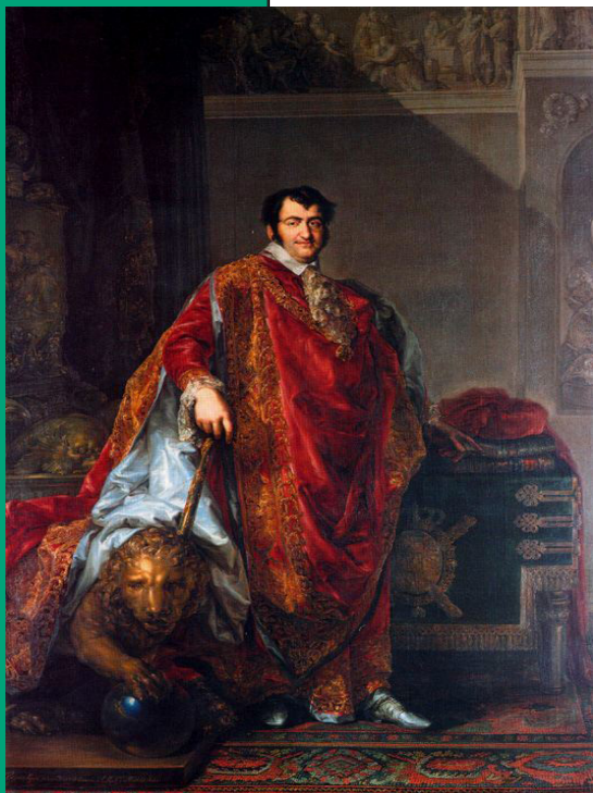
Fernando VII con el hábito de la Orden del Toisón de Oro. Vicente López Portaña. 1831. Palacio de España en Roma.

Fernando VII de Borbón, llamado «el Deseado» o «el Rey Felón», nació el 14 de octubre de 1784. Hijo de Carlos IV con quién mantuvo muy malas relaciones, habiendo conspirado contra este, primero en 1807 y más tarde en 1808 al encabezar el Motín de Aranjuez, en el que Carlos IV fue destituido. Fue rey de España entre marzo y mayo de 1808, en que fue obligado a restituir el trono a su padre por Napoleón Bonaparte, quién lo apresa y conduce a Bayona (Francia) donde transcurre preso toda la Guerra de Independencia, mientras Carlos IV abdica al trono en favor de José I, hermano del Emperador. Con la derrota y expulsión de Bonaparte, le es restituido el trono de España en diciembre de 1813, mediante el Tratado de Valencay.