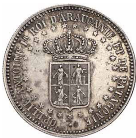
Moneda de 1 peso del Reino de la Araucanía y de la Patagonia fechada 1874

7.La firma del Príncipe Felipe en ésta parece falsa y bastante suave, mientras que en los años posteriores su escritura a mano se convirtió más temblorosa, así que creo que, o bien en un momento anterior Felipe por la razón que sea, le dio la firma en una hoja de papel en