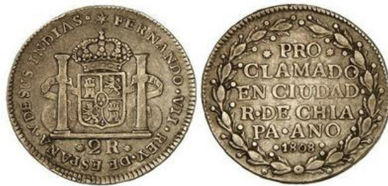
Martí Hervera & Soler y Llach - Subasta 20/04/2010 Lote 573

Medina 290 – Varía de la anterior en el módulo, y en que debajo de las dos columnas dice * 1 R * Leyenda: FERNANDO • VII • REY DE ESPAÑA • Y DE SUS IND •