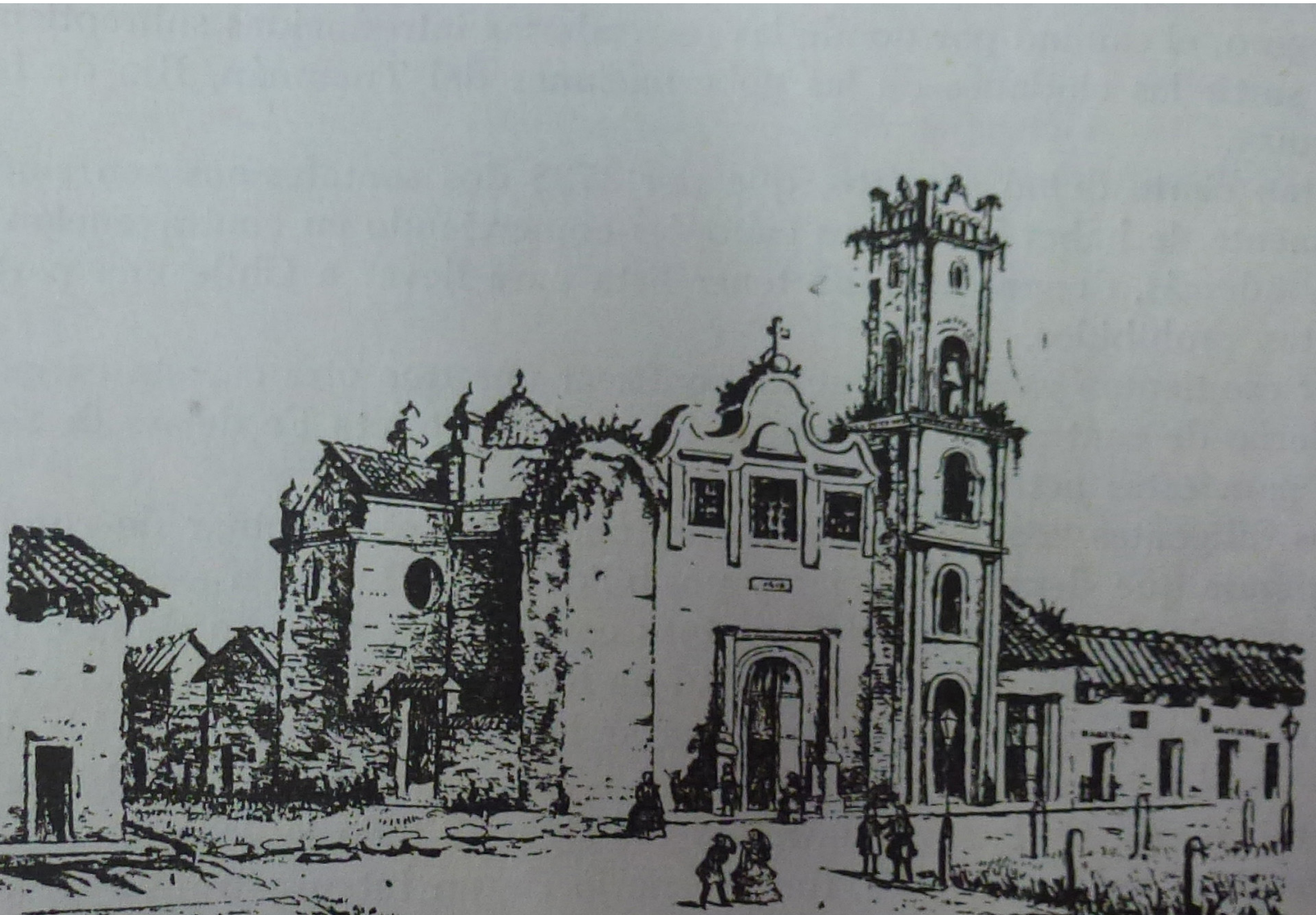
Iglesia y parte del primitivo Colegio de los Jesuitas a fines del siglo XVIII - Litografía de Clairaux, realizada en 1850

Boletín electrónico de Numismática e Historia Centro Numismático Santa Fe