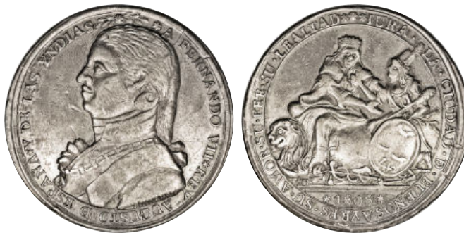
Heritage - Subasta del 15/09/2006 . Lote 51164 u$s 299

Medina 282 – Igual a la precedente, salvo que la leyenda del anverso difiere en el segundo DE, que ésta está abreviado D, y que después de Yndias tiene *