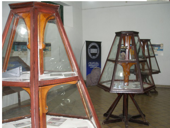
Muestra presentada por el Centro Numismático Santa Fe en la IV Noche de los Museos.