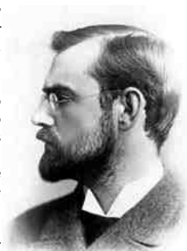
Archer M. Huntington (aprox. en 1900)

Huntington entregó su vida al estudio de la cultura española, y en 1904 fundó la Hispanic Society of America (HSA) , una institución pública que alberga todo tipo de tesoros de nuestro país. Entre ellos, catorce lienzos de Sorollapintados por encargo, obras de Goya, textiles medievales, piezas romanas... y hasta hace tres meses, la mayor colección de monedas del mundo hispánico que existía fuera de España . Un catálogo de 38.000 piezas que reunió mediante compras a particulares de Europa y América Latina.