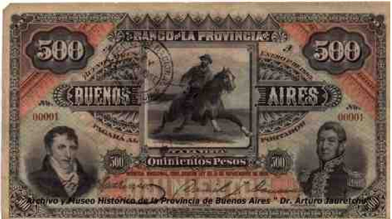
Fig. 3 — Quinientos pesos moneda nacional oro — Banco de la Provincia de Buenos Aires — 1° Enero de 1885 — Nusdeo 272.

primeros billetes emitidos en 1895, a nombre de “La Nación Argentina”. En los billetes emitidos por la Caja de Conversión aparece en los valores de Quinientos pesos moneda nacional un retrato de Manuel Belgrano, atribuido al pintor francés Juan Felipe Goulu (1795-1855). (Fig.5).