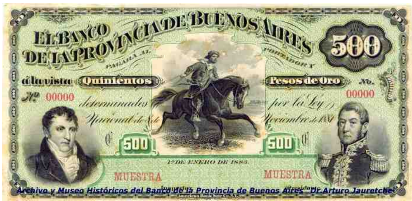
Fig. 2 — Quinientos pesos de Oro – Muestra Banco de la Provincia de Buenos Aires – 1° de Enero de 1883 – Nusdeo 263.

Nuevamente en 1885, el Banco de la Provincia de Buenos Aires hace imprimir por la American Bank Note Co Nueva York valores a pesos moneda nacional oro. En los billetes de Quinientos Pesos vuelve a imprimirse el busto de Manuel Belgrano idéntico al valor de 1883. (Fig. 3)