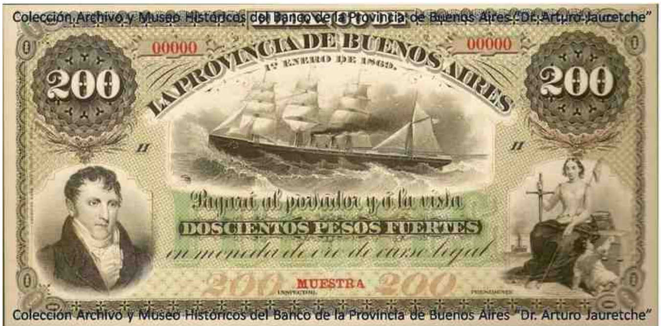
Fig.1 — Doscientos pesos fuertes . Tipo II - Muestra - Banco de la Pcia de Buenos Aires – 1° Enero 1869 – Nusdeo 243.