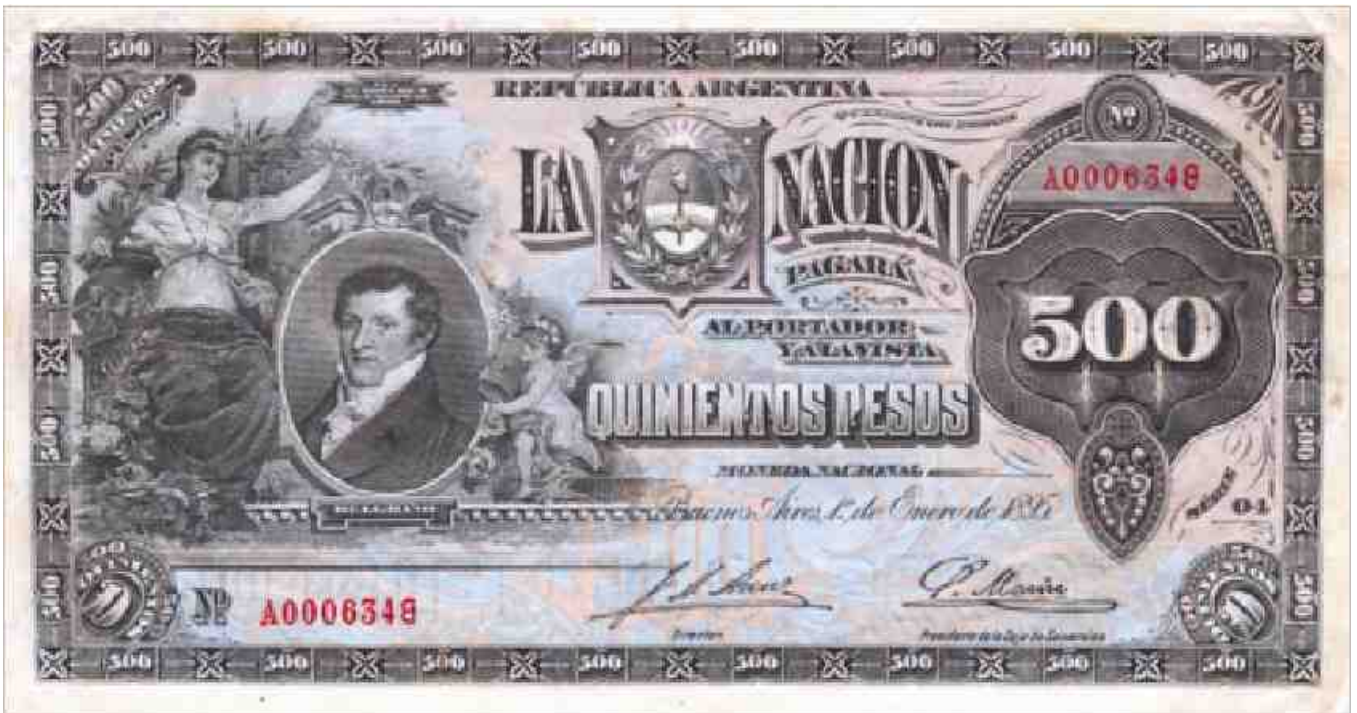
Fig. 5 — Caja de Conversión – Emisión 1° de enero 1895 – Impresos por La Compañía Sudamericana de Billetes de Buenos Aires – Nusdeo 701