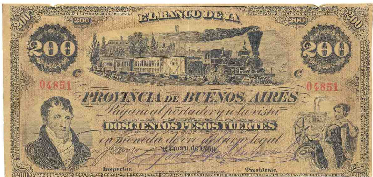
Fig 1 — 200 pesos fuertes – Tipo I – Banco de la Provincia de Buenos Aires – 1º de Enero 1869 – Nusdeo 242 – Ejemplar falso con diseño adulterado perteneciente al Museo del Banco Central de la República Argentina.