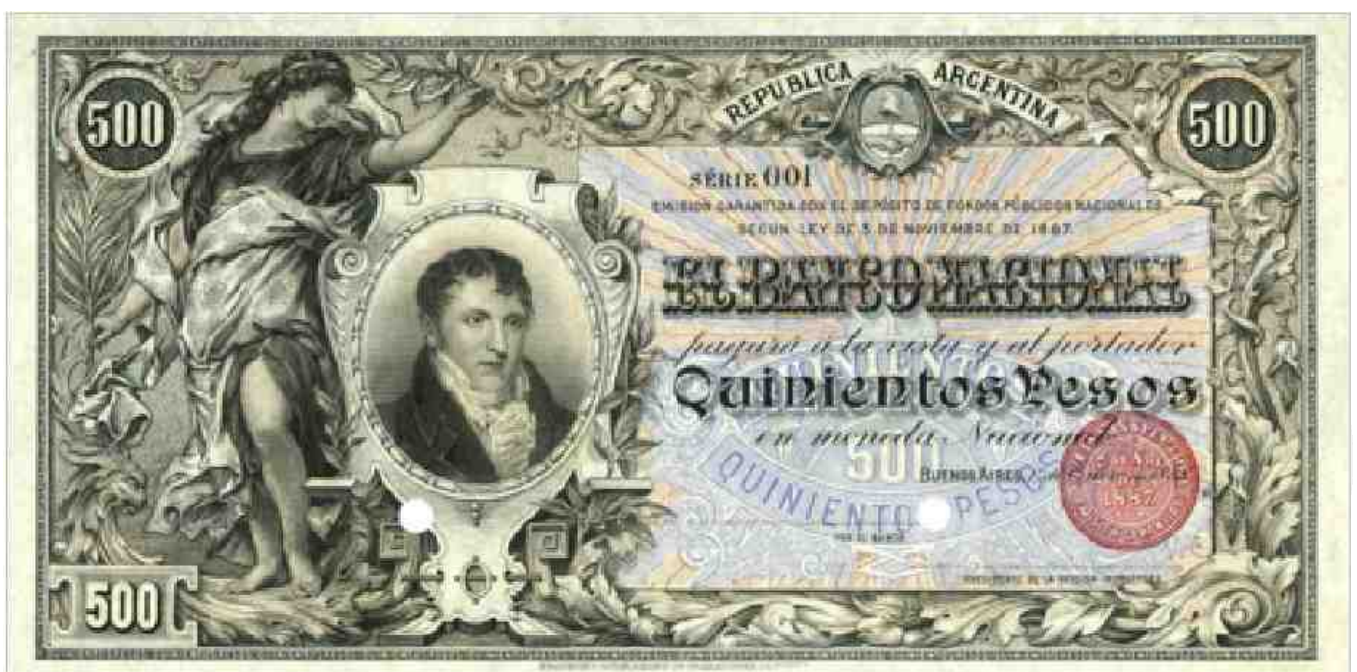
Fig. 4 — Quinientos pesos Moneda Nacional. Bancos Nacionales Garantidos — El Banco Nacional — Nusdeo 508

En la emisión realizada por el Banco Central de la República Argentina en Pesos Moneda Nacional, entre los años 1942 y 1969, no aparece la imagen de Belgrano en ninguno de los valores, pero si lo hace en el filigrana de los mismos, con el busto en perfil del prócer en los valores de 5 a 10.000 pesos m/n. (Fig. 6)