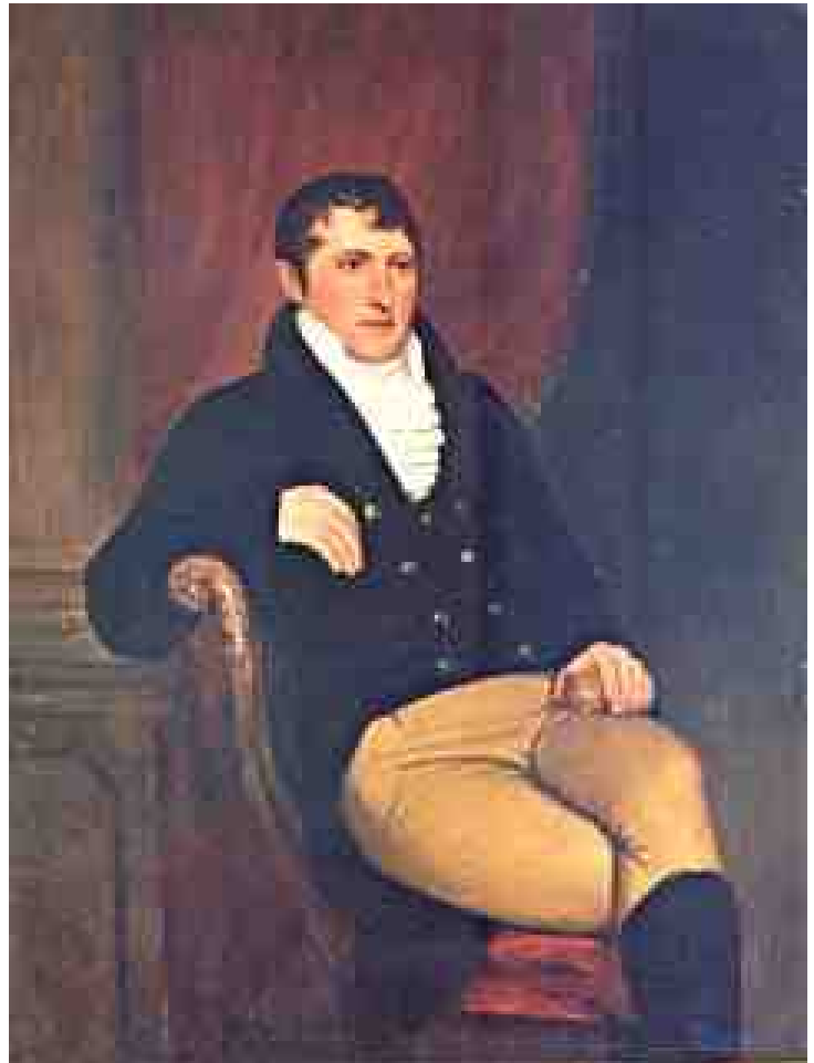
Óleo de Prilidiano Pueyrredón

En 1883 el Banco de la Provincia de Buenos Aires emite billetes en pesos de oro, impresos por American Bank Note Co Nueva York. En el valor de Quinientos pesos oro se observa el busto del General Manuel Belgrano, igual al impreso en los billetes anteriores, a la izquierda y del General José de San Martín a la derecha. (Fig.2).