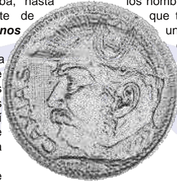
Duque de Caixas - 2000 reales - 1935

se perdió el nombre de batalla de Morón para tomar el de Caseros, sector donde lucharon las fuerzas brasileñas. Era aceptar una primacía que ya estaba en los hechos, pues Caseros inicia la era de la hegemonía brasileña en el Río de la Plata. ( Argentina-Brasil: cuatro siglos de rivalidad por Miguel Angel Scenna ).