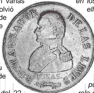
CJ Rioja 63.2

Peso: 6,7 gr. - Ley: 875/1000 - Módulo: 26.8 mm. - Ceca: "R" (Rioja). Ensayador: No presenta. - Cantó: Laureado.