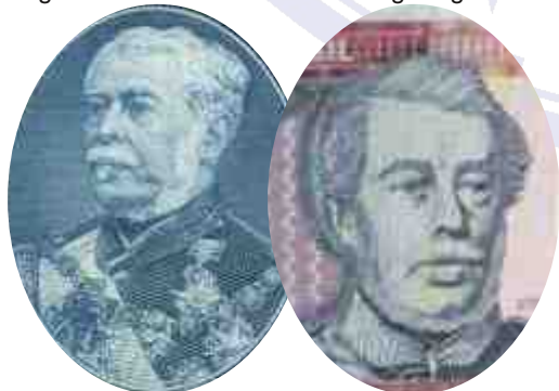
Retratos del Duque de Caxias en billetes: dos cruzeiros (izquierda) y cien cruzeiros (derecha).

Era usada en el pecho, sobre el costado izquierdo y los generales podían usarla colgada del cuello en eventos de gran gala.