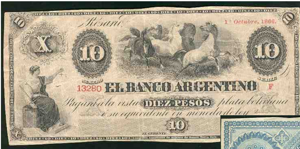
Diez Pesos Plata Boliviana Impreso en negro en el anverso sobre rosa claro y azul en el reverso sobre papel blanco.