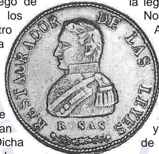
CJ Rioja 63.1

Con la fecha de 1842 no se conoce piezas que luzcan el tipo de la ley del 30 de noviembre.