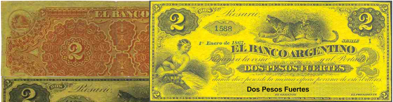
Rosario 1° Enero de 1867 – Anverso impreso en negro sobre fondo amarillo – Numeración de 4 a 5 dígitos en color azul – Imagen de un tigre en la parte media superior. Reverso impreso en rojo