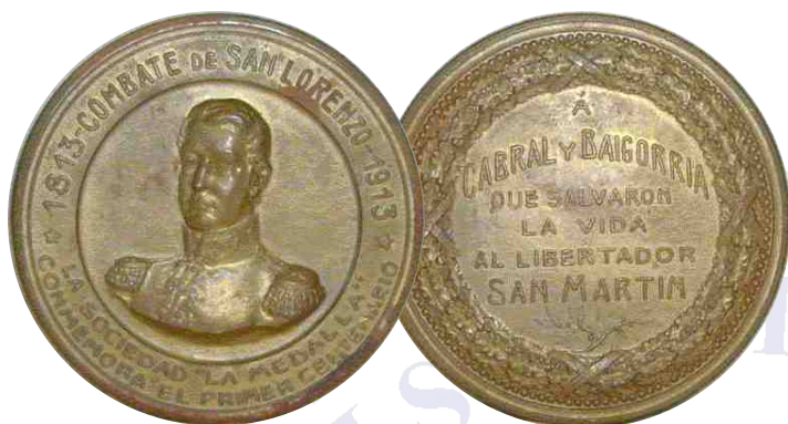
Medalla Conmemorativa del Centenario. Módulo 4,5 mm

Anverso: En el centro, busto de San Martín perfil derecho. Arco superior: 1813 - COMBATE DE SAN LORENZO - 1913; arco inferior: LA SOCIEDAD "LA MEDALLA" / CONMEMORA EL PRIMER CENTENARIO. Estrellas de cinco puntas separan las leyendas.