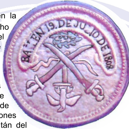
Escudo de Distinción de Bailén. Ejemplar Único. Museo Histórico Nacional.

Esta victoria permite al ejército de Andalucía recuperar Madrid y es la primera derrota importante de las tropas de Napoleón. San Martín recibe el grado de teniente coronel y es condecorado con una medalla de oro. Continúa luchando contra los franceses en el ejército de los aliados: España, Portugal e Inglaterra. Combate a las órdenes del general Beresford en la batalla de Albuera. Conoce a Lord Macduff, noble escocés, que lo introduce a las logias secretas que conspiraban para conseguir la independencia de América del Sur. Ahí hace contacto por primera vez con círculos de liberales y revolucionarios, que simpatizaban con la lucha por la independencia americana.