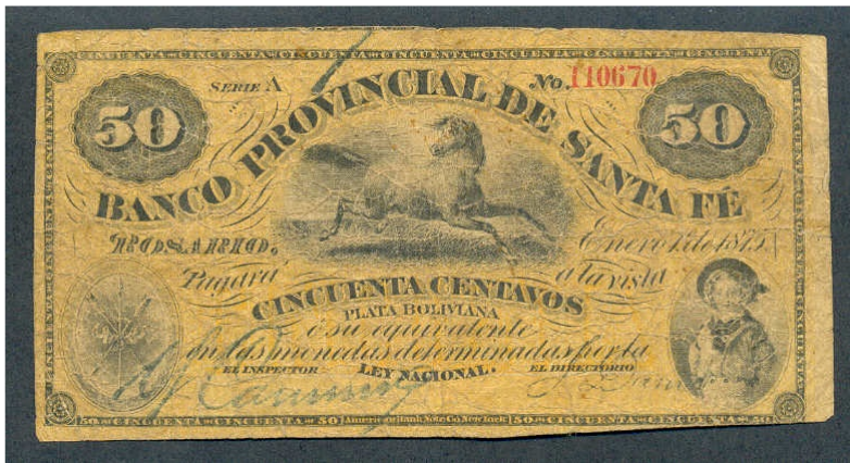
Ejemplar de 50 centavos con numeración en rojo