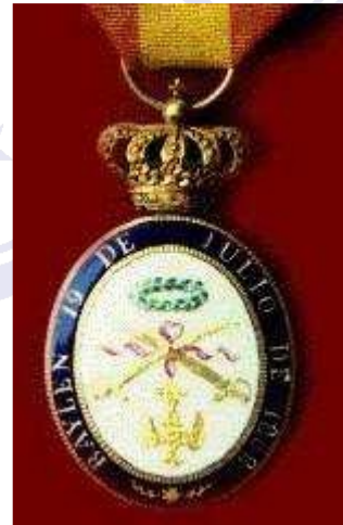
Medalla de Distinción de Bailén que perteneció al General José de San Martín. Museo Histórico Nacional.