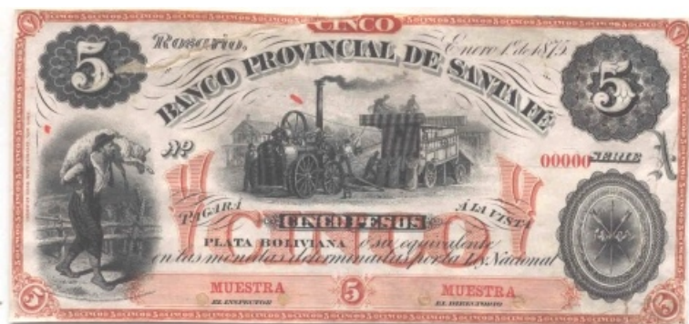
Cinco Pesos Plata Boliviana

Tanto en los billetes datados en Rosario como en Santa Fe, se pueden observar a la izquierda un pastor cargando una oveja y a la derecha el escudo de armas de la Provincia. En el centro se presenta un tractor a vapor y un carro de cosecha. Al reverso hay una cabeza de perro. En los billetes de Rosario serie A, el impreso es en negro sobre un fondo ladrillo mientras que el anverso el impreso es de color verde olivo. Los números están impresos en rojo y las medidas 184 x 85mm. En los de Santa Fe, Serie "A", estampados en negro sobre fondo verde. Reverso estampado en verde. Igual descripción que el de Rosario.