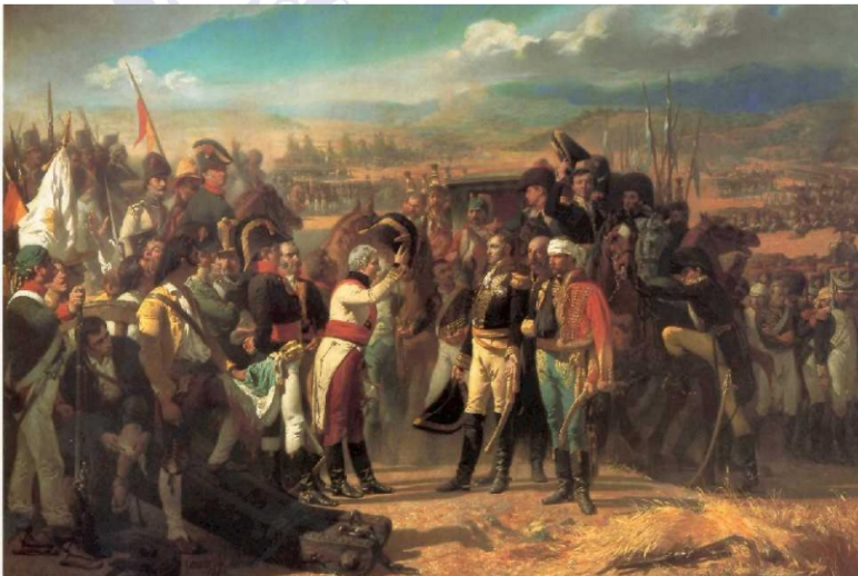
"Rendición de Bailén" de José Casado del Alisal 1864 – Museo del Prado

Evoluciones: no tiene, aunque existen ejemplares circulares sin esmaltes y otros de forma romboidal, además de los ovalados.