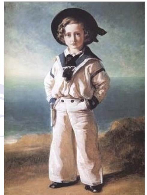
Pintura de la que se saca la imagen del niño