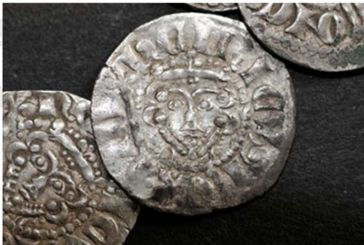
Los historiadores creen que las monedas formaban parte de los impuestos que los campesinos pagaban a la Iglesia.