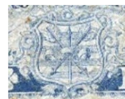
Principales diferencias de diseño