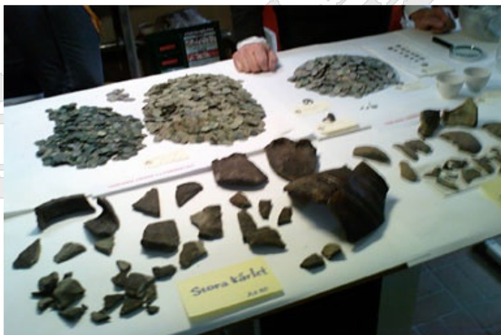
Objetos recuperados en el sitio