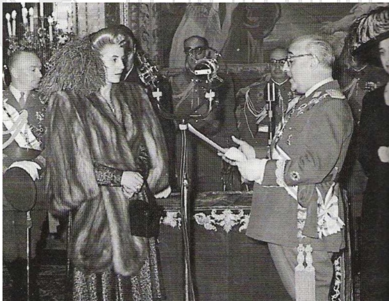
El generalísimo Franco la condecora con la Gran Cruz de Isabel la Católica en el Palacio Real. 9 de Junio de 1947.

"Aunque en su origen la Orden constaba de tres categorías, con fecha 7 de octubre de 1816, a sugerencia del Capítulo de la Orden, los Caballeros de primera clase pasaron a denominarse Comendadores y los de segunda clase Caballeros".