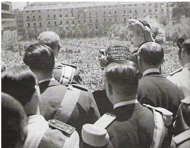
La multitud la ovacionó

Terminada la ceremonia se dirigieron al gran balcón del Palacio de Oriente a encontrarse con la multitud que los aguardaba, Evita se dirigió con estas palabras "Se que mi presencia no colma vuestros anhelos. Deseabais os visitara el general Perón, quien en horas amargas de vuestra vida nacional se presentó ante el mundo batallando por los fueros de España, con la valentía de hijo bien nacido que se juega entero por su madre...".