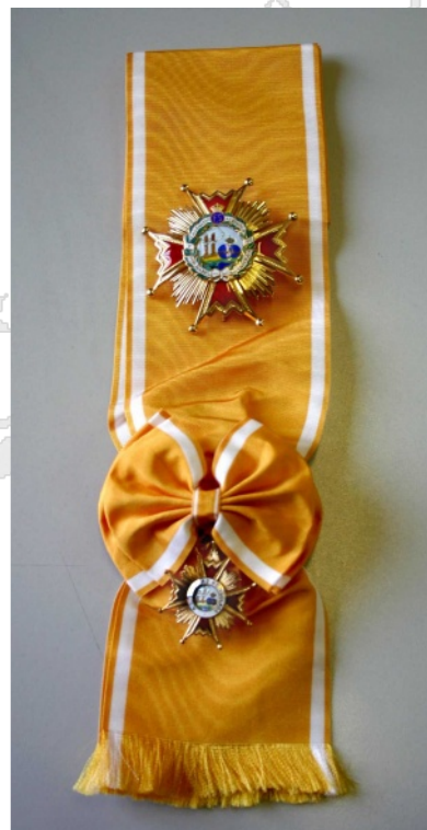
Gran Cruz de Isabel La Católica (Optativa Señoras)