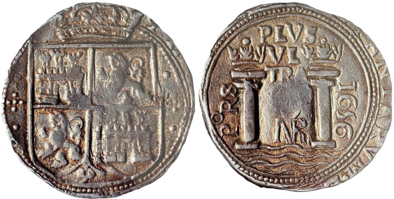
8 reales 1656 NR PoRS