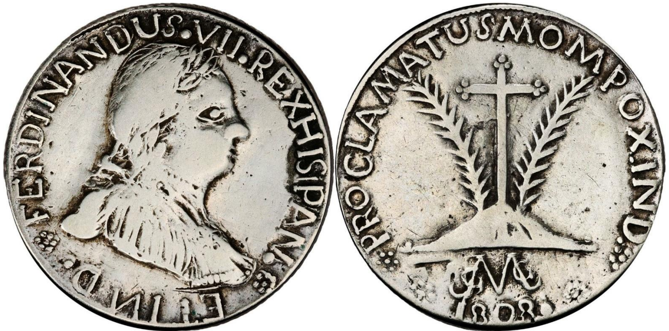
Jura de 4 reales de Santa Cruz de Mompox 1808