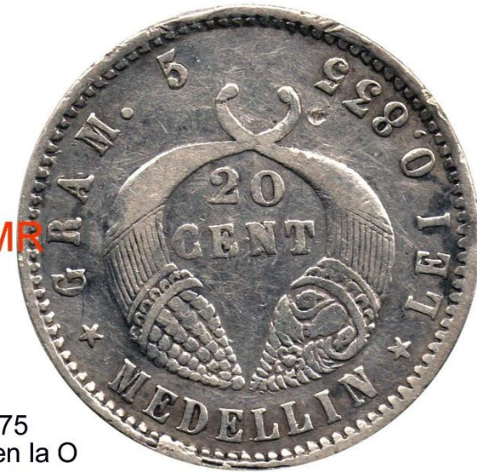
1875 Sin B en la O