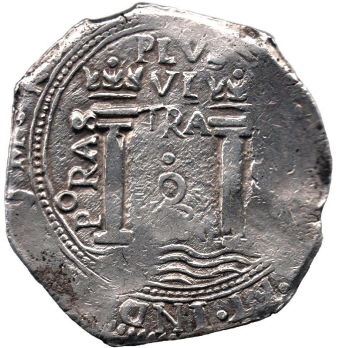
8 reales (Ca. 1652-53) N.R. PoRAS, M 46-10