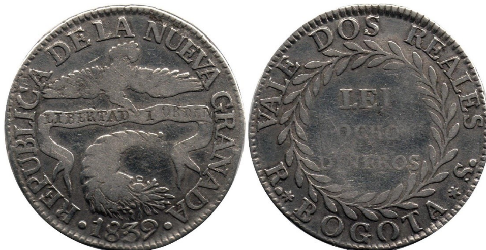
2 reales 1839 B. R.S., R 187-1