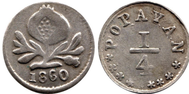
1 cuarto de décimo 1860 P. 9 estrellas, R 241-1