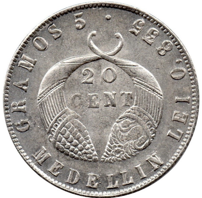
20 centavos 1885 M. Ley 0,835/0,500, R 289-5