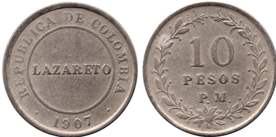
10 pesos 1907 Lazareto, R 376-1