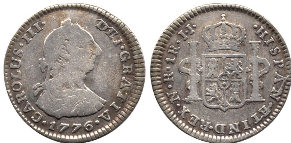
1 real 1776 N.R. J.J., R 38-7