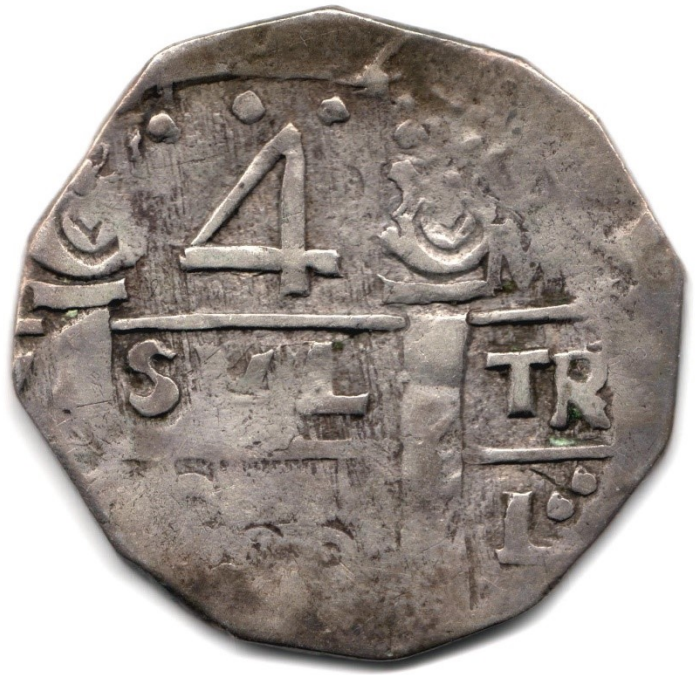
4 reales 800 Cartagena (Ca. 1815), R 119-1