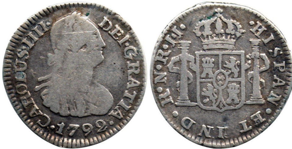
½ real 1792 N.R. J.J., R 77-1