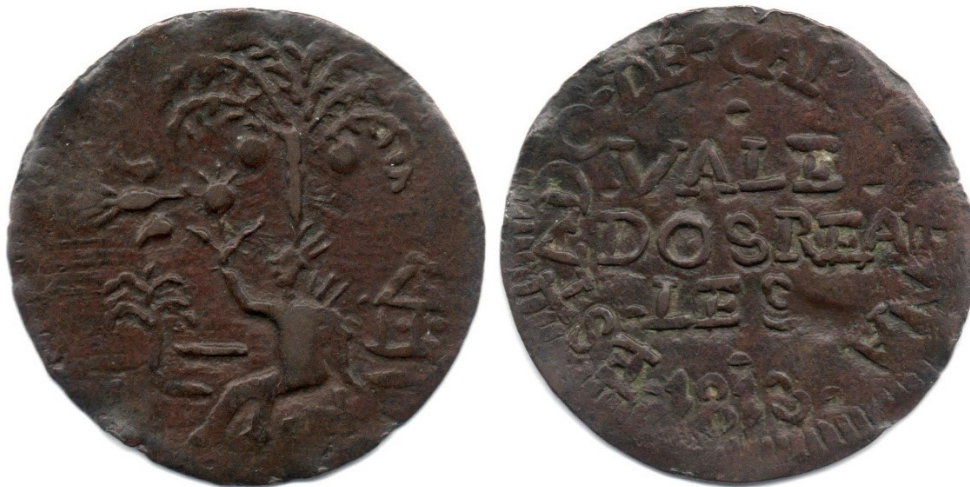
2 reales 1813 Cartagena, R 136-2