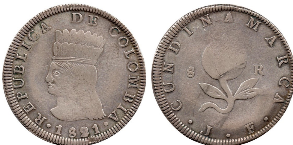
8 reales 1821 J.F. (sin BA), R 157-3