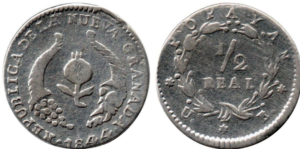
1/2 real 1844 P. U.E., R 178-18