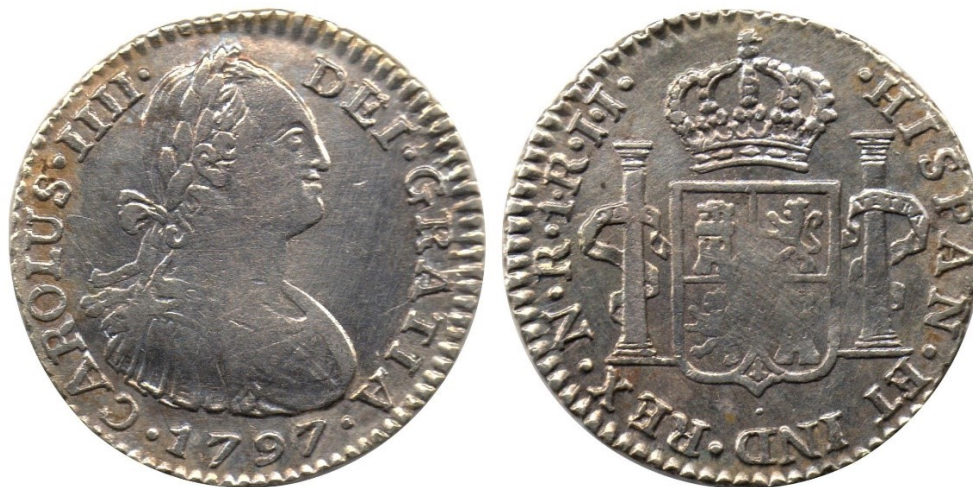
1 real 1797 N.R. J.J., R 78-20