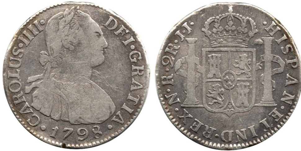
2 reales 1798 N.R. J.J., R 80-10