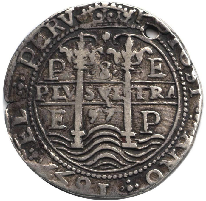
8 reales 1657 E, Royal