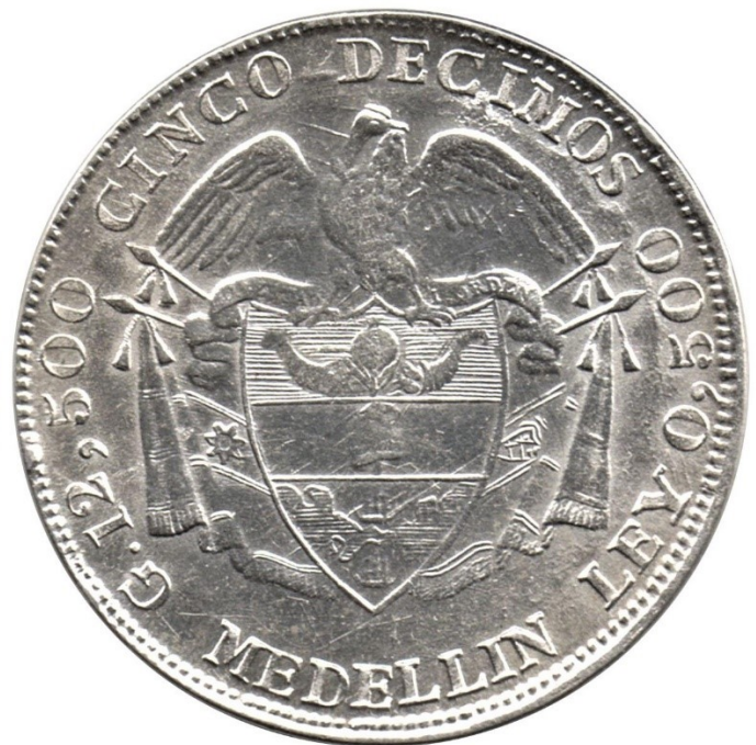
5 décimos 1888 M. Cara Clásica (R 400-2)