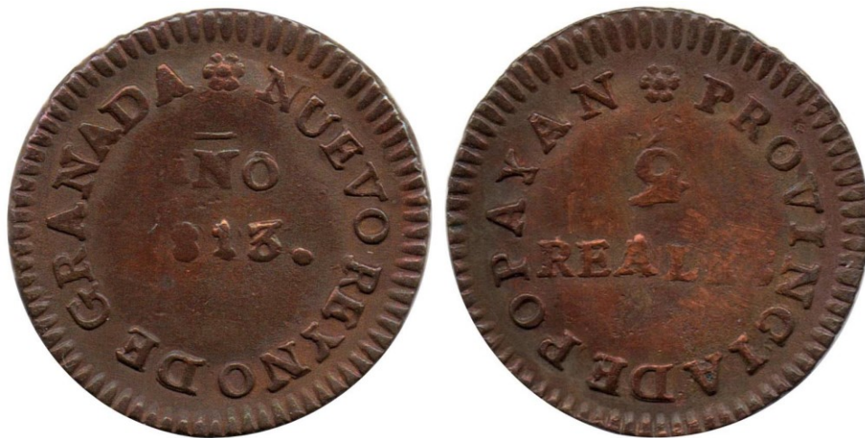
2 reales 1813 P. fecha pequeña, R 116-1 a