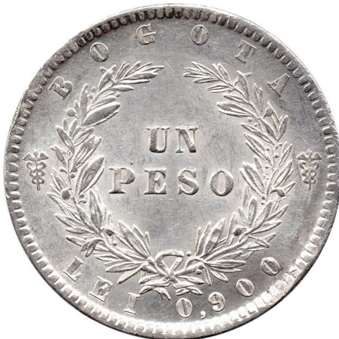
1 peso 1859 B., R 226-2