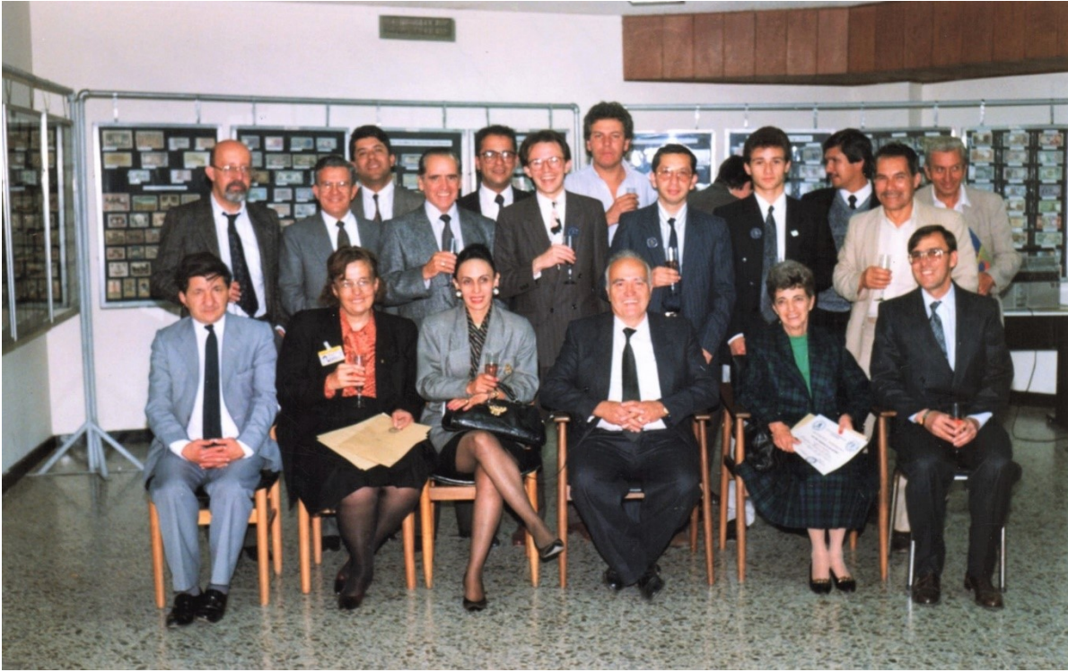
Foto con todos los participantes el día de la clausura de la exposición.

Set de fichas en acrílico entregadas a los visitantes.