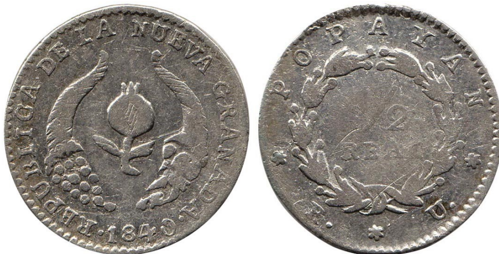
½ real 1840 P. R.U., R 178-5