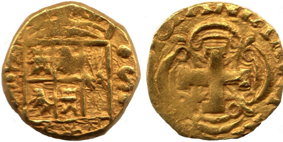
1 escudo Nuevo Reino Fernando VI (1753-56), M 92-4