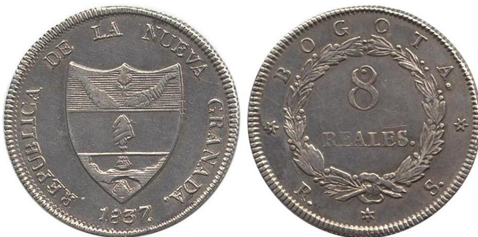
8 reales 1837 B. "Granadino", anverso doble, R 193-1 a