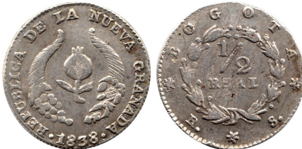
½ real 1838 B., R 177-1