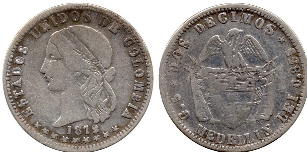
2 décimos 1872 M. efigie diferente, R 283-1