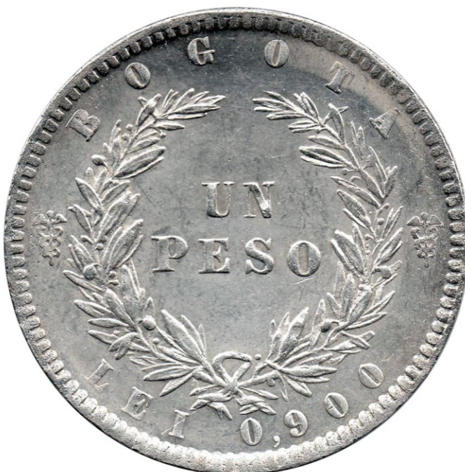
1 peso 1861 B., 226-5