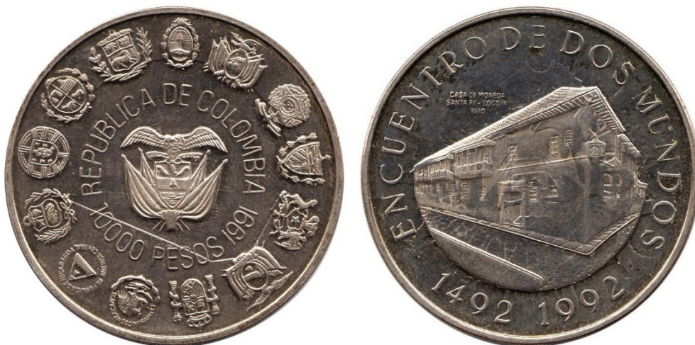
10 000 pesos 1991, ensayo en níquel, R pág. 269