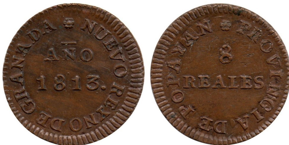
8 reales 1813 P., R 121-1