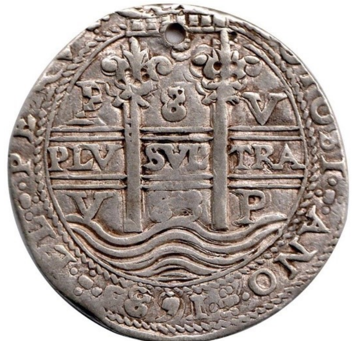
8 reales 1683 V, Royal

Estas macuquinas prácticamente redondas se consideran piezas de presentación y son muy raras. Casi siempre se consiguen perforadas y ese detalle no afecta su valor.