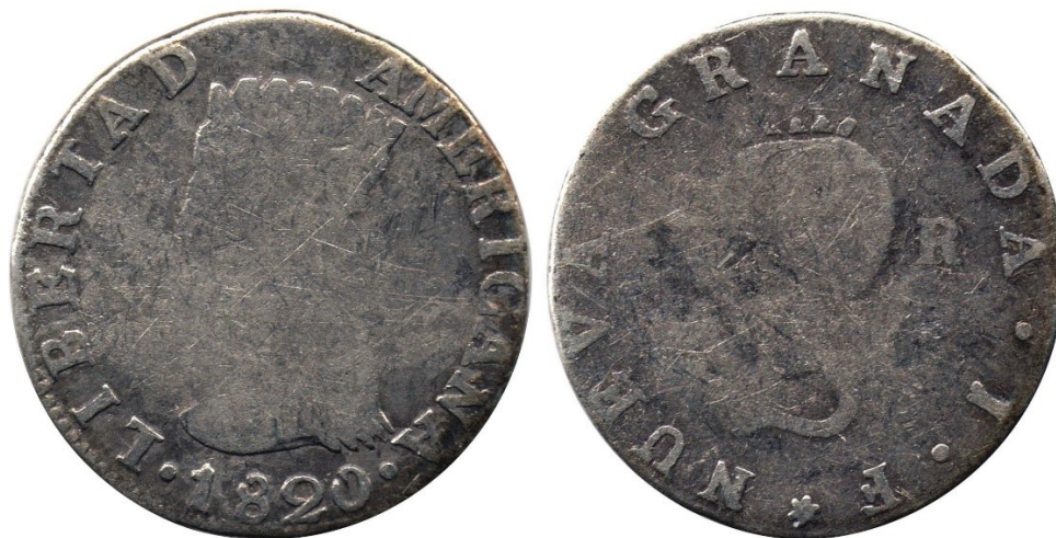
2 reales 1820 J.F. Libertad Americana, R 140-2