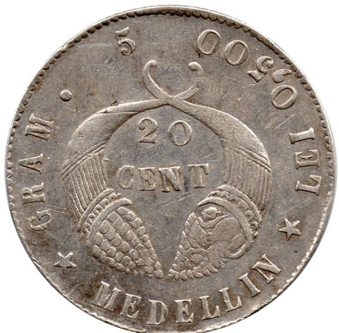
20 centavos 1886 M., R 291-1