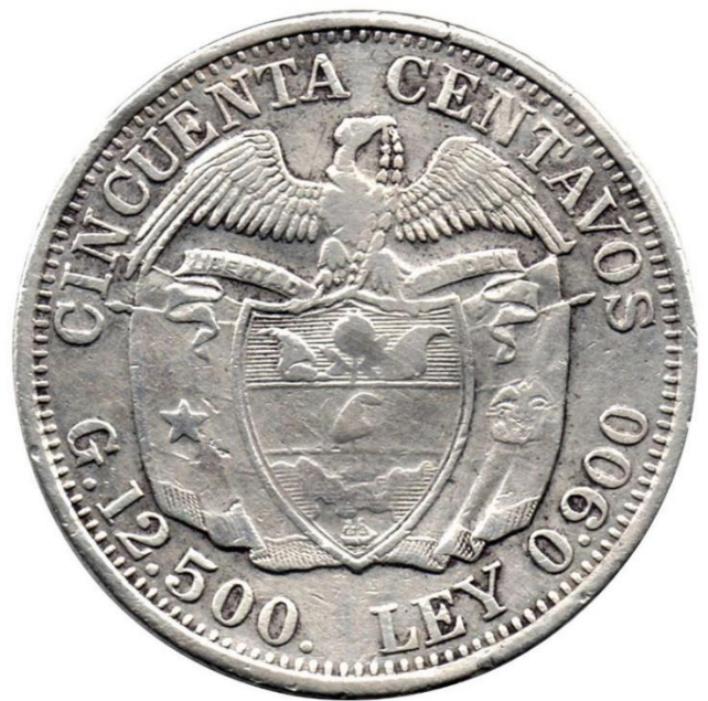
50 Centavos 1932 M. con doble golpe de troquel