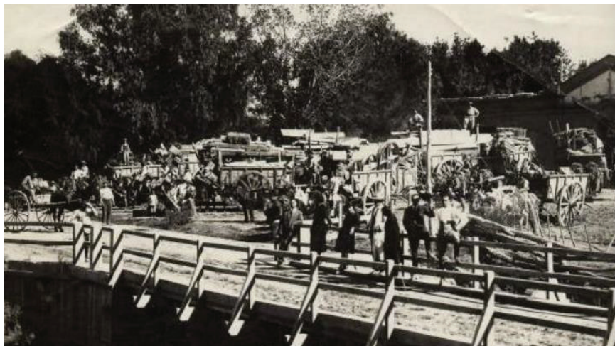
El molino harinero que se transformó en uno de los más importantes de Cuyo