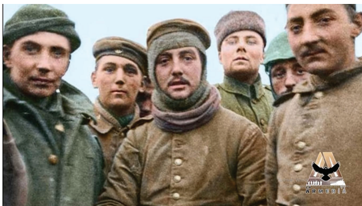
Imagen fotográfica coloreada por computadora

El día de Navidad, tímidamente comienzan a asomarse al parapeto y a ocultarse rápidamente, esperando los disparos, pero no ocurre nada, de repente un alemán está completamente afuera de la trinchera agitando los brazos, un inglés hace lo mismo, van saliendo otros soldados y a recorrer la “tierra de nadie” hasta encontrarse en el medio, nadie disparó tal cual lo prometido la noche anterior.