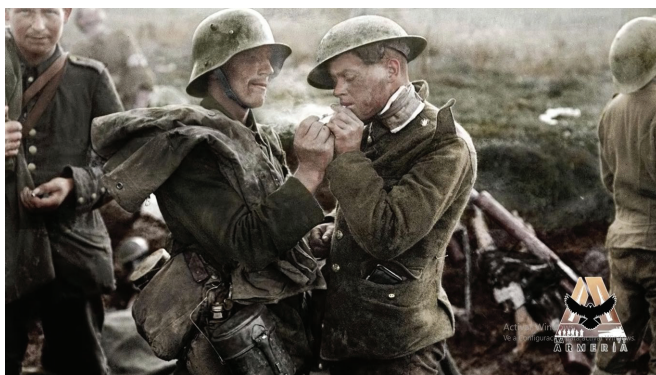
Imagen coloreada que muestra intercambio entre "enemigos"

Los alemanes sacan algunas fotos y proponen volver a hacer la tregua en año nuevo para ver cómo salieron las fotos. Un sentimiento de camaradería surge entre soldados de ambos bandos. En las cartas que luego escriben relatan que la sensación es muy rara, ayer trataban de matarse, se odiaban, hoy comparten y juegan a la pelota.