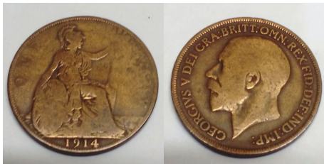
Moneda inglesa del año en que comenzó la "Gran Guerra"

También se han rodado algunas películas y documentales sobre el tema.