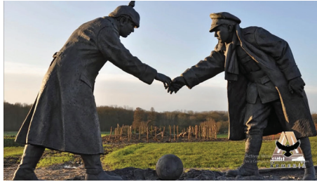
Monumento en honor a la tregua

Años más tarde, en la década del '80, Paul McCartney hizo su videoclip "Pipas de la Paz" en donde muestra de alguna manera, lo que ocurrió en esa Navidad. En el video, el cantante hace a la vez de soldado alemán y soldado inglés, conversan, se muestran fotos de sus respectivas novias y la paz es interrumpida por un avión que lanza una bomba, cada uno corre a su trinchera a seguir la guerra pero con las fotos cambiadas.