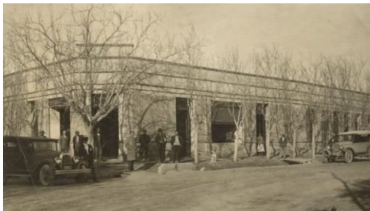
Almacén que perteneciera a Ibáñez

Fueron muchas las obras que realizó durante su mandato. Entre las más importantes se cuentan el fomento de la agricultura y la ganadería, y también incentivó a otros hacendados para que incrementaran sus producciones en aquel departamento. Otras de las medidas que tomó durante su gestión fue la ocupación de trabajadores inmigrantes, en su mayoría de origen italiano, para las labores del campo. Uno de sus fundamentos para acogerlos fue su ascendencia vinculada a ese país. Al respecto es importante destacar que su abuelo se llamaba Ibáñez Raspigliosi y su chozno abuelo materno había llegado de Génova y se había instalado en Bolivia a principios del siglo XVII, con el nombre de Pietro Raspigliosi. Luego éste se casó con Agustina Ibarzábal, hija de Roberto Albino, quien fue un gran colaborador de la campaña liberadora de los Andes en 1817.