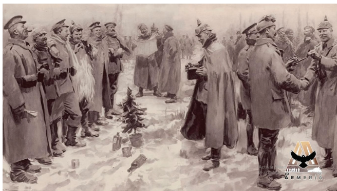
Reproducción artística de la tregua