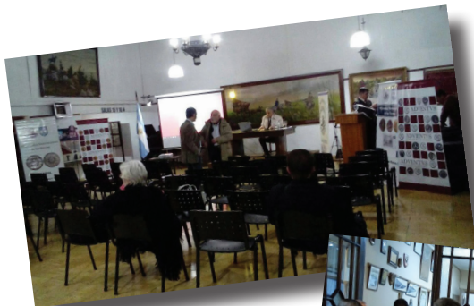
Algunas imágenes de ediciones anteriores....