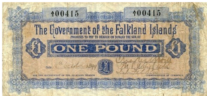
1 Libra 1899 Emisión 16-10-1899 192x88mm Impresor: Thomas de la Rue & Co. Ltd. Catálogo: WPM #A-3a.1

La población inglesa en las islas fue creciendo y al finalizar el siglo XIX se inicia la emisión de papel moneda propio de la Gobernación de las Malvinas (Falkland Islands en inglés), arrancando con una libra en 1899 y 5 chelines en 1901.