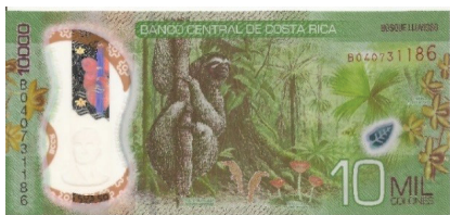
Nuevo – Reverso