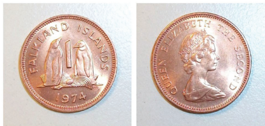
MALVINAS. 1 Peñique 1974 Catálogo: WCC:km2 Ceca: Royal Mint Orientación: Medalla ↑0↑ Peso: 3,5 gramos Diámetro: 20 milímetros Acuñación conocida: 247.450 Material: Cobre Pieza Nro. 426 de la colección del autor

Recién en 1974 ve la luz la primer moneda propia de las Islas Malvinas, un peñique , que representa 1/100 de libra malvinense , a partir de 1972 había cambiado el sistema monetario inglés abandonando el viejo sistema de peñiques, chelines y libras, a partir de ahora la libra se dividía en 100 peñiques o nuevos peñiques (New Penny / New Pences) y en las Malvinas comenzó de esta manera la nueva amonedación.