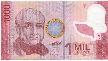
Pick 274 – anverso