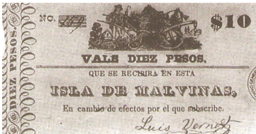
10 Pesos - Islas Malvinas - 1829

La distancia y los medios de comunicación de aquella época jugaban muy en contra de la población instalada en las Islas Malvinas, además de una lucha constante contra buques de distintas nacionalidades que buscaban cazar y pescar sin pagar las debidas licencias al representante del gobierno de Buenos Aires. La falta de dinero llevó a Luis Vernet a emitir un vale o billete de las Islas Malvinas, del cual se conocen pocos ejemplares.