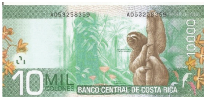
Pick 277 - reverso