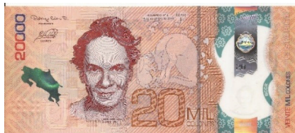
Nuevo – Anverso