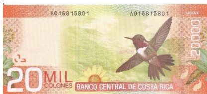
Pick 278 - reverso