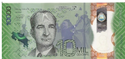
Nuevo – Anverso