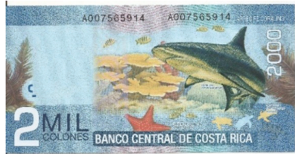
Pick 275 - reverso