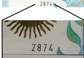
Argentina. 50 Pesos “MUESTRA”

Firmas: Alejandro Vanoli - J. A. Domínguez