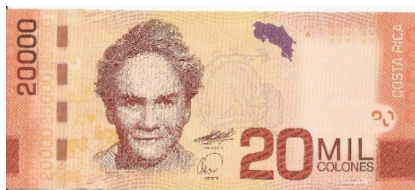
Pick 278 – anverso