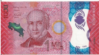
Nuevo – Anverso