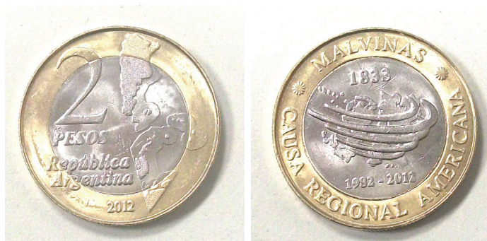
Argentina. 2 Pesos. Fecha de emisión: 20/9/2012. Catálogo: Km176 Composición: Anillo dorado (Cu 92 / Al 6 / Ni 2) Núcleo plateado (Cu75 / Ni 25) Módulo: 24,50mm (Núcleo: 17mm). Peso: 7,20 grs. Espesor: 2,2mm Ceca: Buenos Aires. Canto: segmentado estriado-liso. Alineación: medalla Cantidad acuñada: 4.985.000 Pieza #591 de la colección privada del autor

Cinco años después, para el trigésimo aniversario, sale una nueva moneda de Malvinas, bimetálica, con el centro plateado y el anillo dorado, en el anverso figura el mapa oficial de la República Argentina aprobado por Ley N° 26.651, que incluye la totalidad de los territorios, islas, plataforma continental y sector antártico. A la izquierda el valor nominal: 2 pesos, y debajo: "República Argentina". En tanto del reverso tiene el mapa de las Islas Malvinas parcialmente cubierto por el isotipo de la Unión de Naciones Suramericanas -UNASUR-, la fecha 1833 arriba (año de la usurpación británica) y debajo de las islas las fechas 1982 - 2012. En el anillo dorado en la parte superior figura MALVINAS, y en la parte inferior CAUSA REGIONAL AMERICANA, separadas por sendos soles.