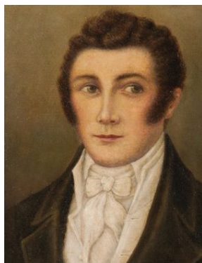
Don Luis Vernet