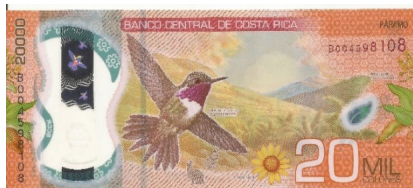
Nuevo – Reverso