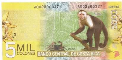
Pick 276 - reverso