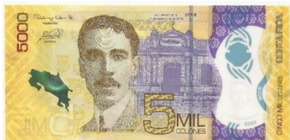
Nuevo – Anverso