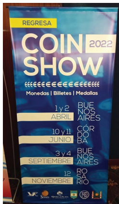
Próximos Coin Show 2022: Córdoba, Buenos Aires y Rosario.