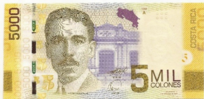
Pick 276 – anverso