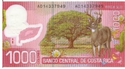
Pick 274 - reverso