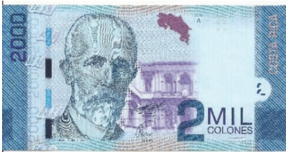
Pick 275 – anverso