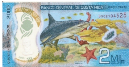
Nuevo – Reverso