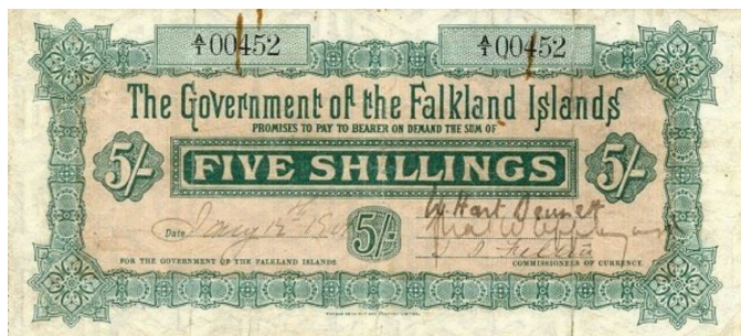
5 Chelines 1901 Emisión 12-01-1901 192x88mm Impresor: Thomas de la Rue & Co. Ltd. Catálogo: WPM #A-1

En las Islas Malvinas era reconocida la Libra Esterlina utilizada en el Reino Unido, pero no así la Libra malvinense en la metrópoli.