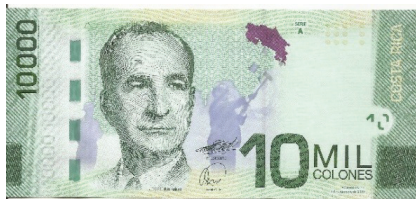
Pick 277 – anverso