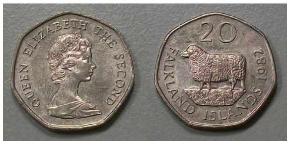
MALVINAS. 20 Peñiques 1982 Catálogo: WCC:km17 Ceca: Royal Mint Canto: heptagonal Orientación: Medalla ↑0↑ Peso: 5,00 gr. Diámetro: 21,95 mm Material: Cuproníquel Pieza Nro. 212 de la colección del autor.

Junto con el ejemplar que se expone más arriba, se emitieron monedas de ½ peñique, de 2 de 5 y de 10. Recién para 1980 se introduce la moneda de 50 peñiques y en 1982 la de 20 peñiques.