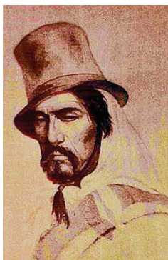
Imagen usada comúnmente para representar al Gaucho Rivero

Una vez retirada la Clío, éste comerciante entre otros comenzaron a aprovecharse de la situación en la que se vivía en las islas, entre otras cosas, pagaban los jornales a los gauchos con los vales (billetes) emitidos por Vernet, cuando parece que los gauchos (llevados a las islas por Vernet para las tareas rurales) habían acordado con el Capitán de la Clío, que cobrarían en moneda contante y sonante de oro o plata. El descontento se hizo general y poco tiempo después los gauchos se sublevaron y pasaron a cuchillo a varios de los responsables de los maltratos, entre los que estaba Dickson. Algunos pobladores con sus fami-