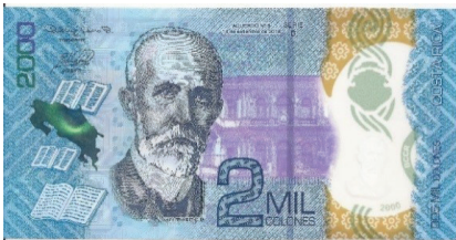
Nuevo – Anverso