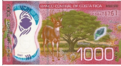
Nuevo – Reverso