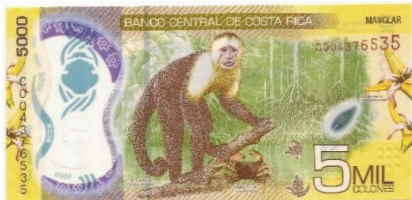
Nuevo – Reverso