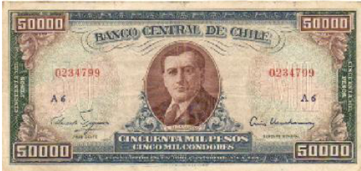
Chile, E° 50.000, 1958. P123.