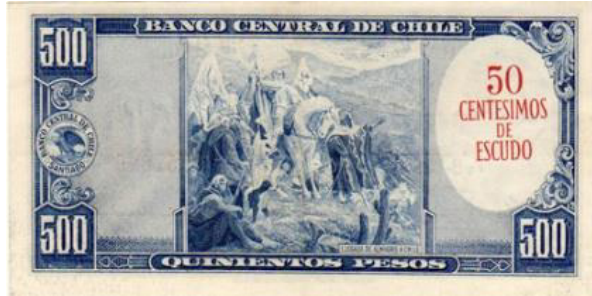
Chile, E° 0,50, 1959. P128.

Todos estos resellos, que cambian las antiguas denominaciones, muestran una apropiada decisión de no incurrir en ir aumentando el valor facial de los billetes por emitir. Sin embargo nunca se pretendió que fueran paliativo ante el avance de la inflación la cual sigue inexorablemente adelante (y disimulada por los bajos valores faciales) minoritariamente apaciguada por las medidas de los ministerios económicos.