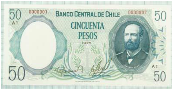
Chile, $ 50, 1975. P151.

Bajo este punto de vista podemos considerar dentro del rango de inflacionarios “netos” a los billetes dentro de las series siguientes: