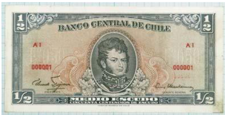
Chile E° 0,50, 1962. P134.

En 1962 surgen los dos primeros billetes con gráfica definitiva, el de E°0,50 y E°1. Se obviaron los valores resellados de E° 0,01, 0,05 y 0,10 porque la inflación hacia inútil emitirlos. Más adelante aparecen sucesivamente los siguientes valores de E°1, E°5, E°10, E°50, E°100. Todos ellos sufrieron la desvalorización gradual inflacionaria hasta ser convertidos en monedas.