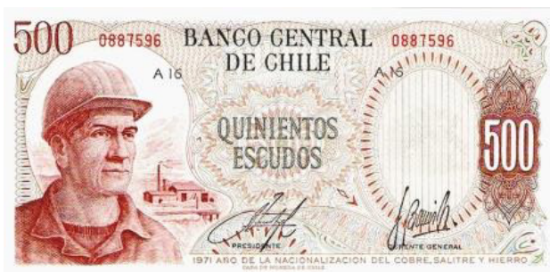
Chile, E° 500, 1971. P145.

Ya para 1972 la inflación estaba disparada en cifras astronómicas que se pretendía paliar con fuertes emisiones de billetes (ver gráfica abajo). Atendiendo a las series de emisiones podemos clasificar de “billetes inflacionarios” a todos los billetes emitidos desde este año de 1972 hasta 1977. Billetes que tienen la dicotomía de ser de valores faciales normales (vale decir sin exceso de ceros) pero con un muy decreciente poder adquisitivo a medida que pasaba el tiempo.