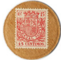
15 cts. Rojo

En cuanto a los personajes que aparecen en los mismos, cabe mencionar a Blasco Ibáñez (2 y 5 céntimos), Pi y Margall (5 y 20), Joaquín Costa o Mariana Pineda (10), Concepción Arenal o Nicolás Salmerón (15), Ruiz Zorrilla (25), Pablo Iglesias (25, 30 y 45), Lope de Vega, Jovellanos o Ramón y Cajal (30 y 50), Emilio Castelar (40 y 60), la famosa cabeza femenina tocada con gorro frigio, similar a la francesa Marianne, símbolo por excelencia del sistema de gobierno republicano (40, 45, 50 y 60), la curiosa serie con la efigie de Alfonso XIII (sobreprensa con las leyendas «República» o «República Española»), etc.