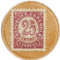
25 cts. Lila