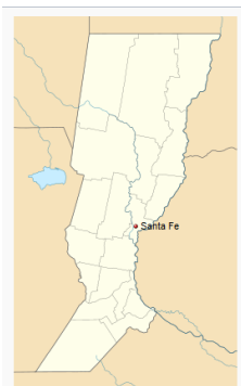
Localización de Santa Fe en Provincia de Santa Fe