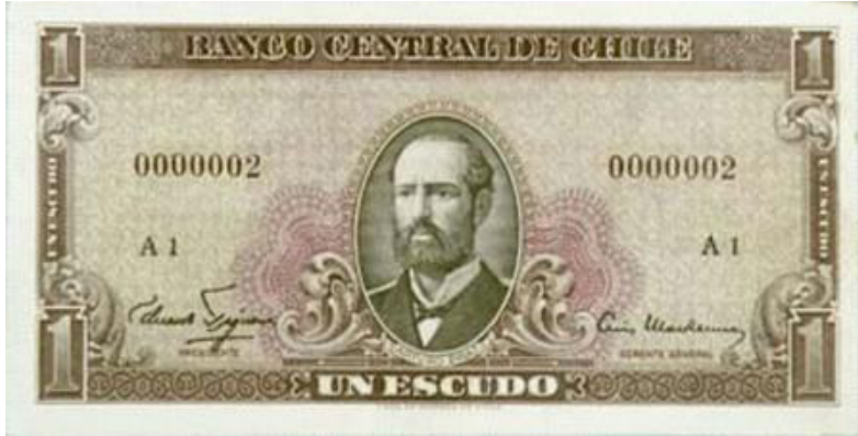
Chile, E° 1, 1962. P135.

En el año 1971, que mostraba ya una inflación del 28,21%, se inicia una escalada inflacionaria, generada por circunstancias sociopolíticas que no viene al caso explicar aquí, que genera una fuerte emisión de circulante papel lo cual dispara la inflación en progresión geométrica (ver cuadro anexo). Políticas del momento hacen que el gobierno en curso realizara grandes emisiones de billetes para paliar el aumento de precio de los artículos básicos de la población chilena.