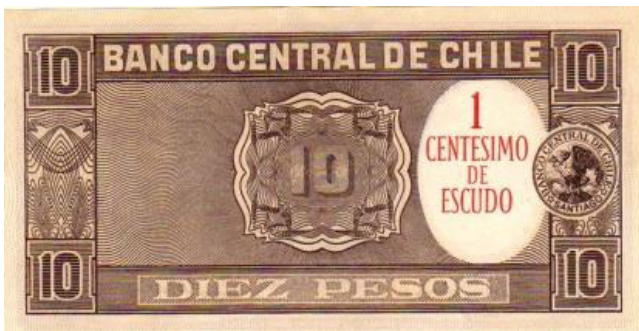
Chile, E° 0,01,1959. P125.

Solo circularon denominaciones reselladas desde E° 0,01 (#125.1) hasta el mencionado billete resellado de E° 50 (impreso sobre el anterior de $ 50.000). Estos ejemplares, si bien de moderado nuevo valor facial, quedan comprendidos entre los inflacionarios porque están dentro de este contexto y nacen a consecuencia de lo mismo.