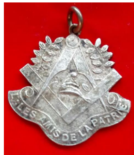
Medalla de la Logia LES AMIS DE LA PATRIE Plata 25mm x 25 m.