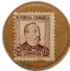
25 cts. Ruiz Zorrilla