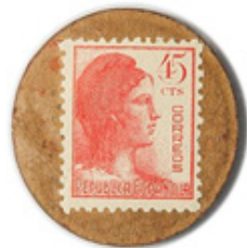
45 cts. Alegoría de la República. Rojo.