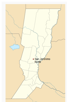
Localización de San Jerónimo Norte en Provincia de Santa Fe

mapas que muestran la localización de San Jerónimo Norte y Santa Fe en la Provincia de Santa Fe.