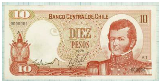
Chile, $ 10, 1975. P150b.