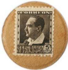
5 cts. Blasco Ibáñez. Marrón oscuro

En cuanto a los personajes que aparecen en los mismos, cabe mencionar a Blasco Ibáñez (2 y 5 céntimos), Pi y Margall (5 y 20), Joaquín Costa o Mariana Pineda (10), Concepción Arenal o Nicolás Salmerón (15), Ruiz Zorrilla (25), Pablo Iglesias (25, 30 y 45), Lope de Vega, Jovellanos o Ramón y Cajal (30 y 50), Emilio Castelar (40 y 60), la famosa cabeza femenina tocada con gorro frigio, similar a la francesa Marianne, símbolo por excelencia del sistema de gobierno republicano (40, 45, 50 y 60), la curiosa serie con la efigie de Alfonso XIII (sobreprensa con las leyendas «República» o «República Española»), etc.