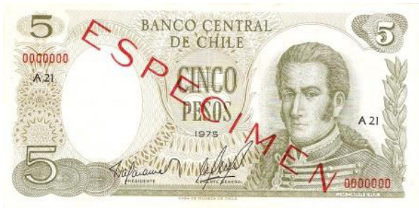
Chile, $ 5, 1975. P149.

En 1975 ocurre la segunda reforma monetaria mediante el Decreto Ley N°1.123 del 24 del agosto del mismo año, realizándose un nuevo cambio de unidad monetaria. Se cambia del escudo a un nuevo peso en razón de cambio de 1.000:1. Así E° 1.000 serán igual a $ 1 nuevo peso. Con esto se vuelve a evitar tener billetes de gran valor facial, procedimiento muy acertado a nuestro parecer.