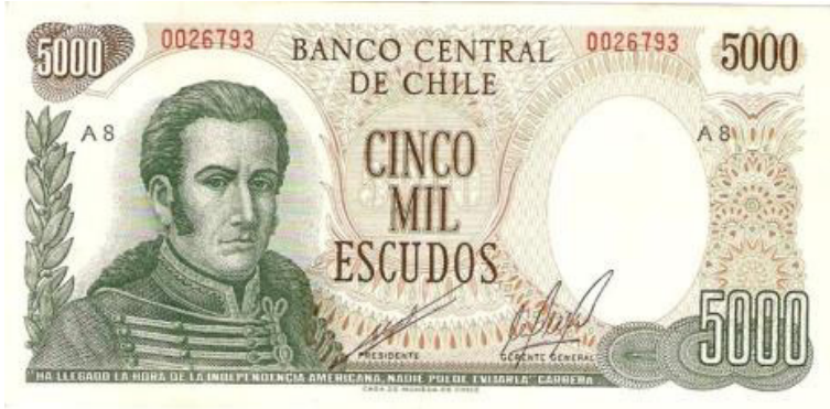
Chile, E° 5.000, 1967, P147.

En 1975 ocurre la segunda reforma monetaria mediante el Decreto Ley N°1.123 del 24 del agosto del mismo año, realizándose un nuevo cambio de unidad monetaria. Se cambia del escudo a un nuevo peso en razón de cambio de 1.000:1. Así E° 1.000 serán igual a $ 1 nuevo peso. Con esto se vuelve a evitar tener billetes de gran valor facial, procedimiento muy acertado a nuestro parecer.