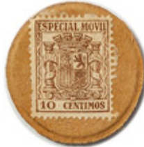
10 cts. Marrón