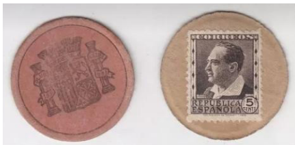
5 cts. Blasco Ibáñez . Marrón oscuro.