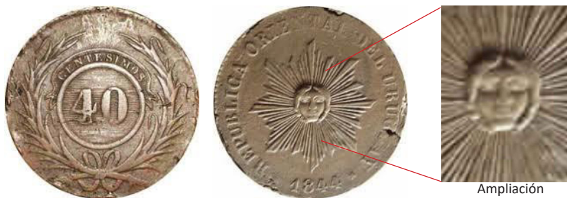
Cobre, módulo 39mm, peso 38 grs, año 1844. Cantidad acuñada 65.000 de 40 centésimos de real.

El Sol de Cabellera es una moneda uruguaya, que junto con la del Sitio de Montevideo, son importantes en el monetario uruguayo.