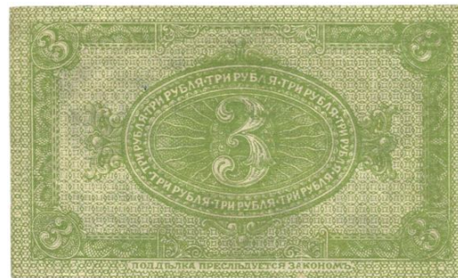
Anverso y reverso del billete de 3 rublos (propiedad del autor)