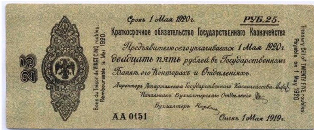
Bono de 1919 por 25 rublos

Al frente de un numeroso ejército, Kolchak avanzó por Siberia hasta los confines de la Rusia europea, donde se le unió un contingente adicional formado por prisioneros de guerra bohemios y moravos que se habían rebelado contra los bolcheviques (la Legión Checa ). Desde finales de 1918 hasta comienzos de 1920 luchó contra el Ejército Rojo en la región de los Urales; pero fue derrotado y hubo de retirarse hacia el este. Sus propios soldados se amotinaron y lo entregaron a las autoridades soviéticas, que le mantuvieron prisionero en Irkutsk hasta que se enteraron que una fuerza se dirigía a la ciudad con las intenciones de rescatarlo, entonces apuraron los trámites y lo ejecutaron junto a uno de sus ministros.