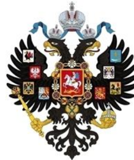
Escudo del Zar

Aleksandr Kolchak era almirante de la Flota del Mar Muerto al momento de la Revolución de 1917, al mantenerse fiel al régimen zarista fue destituido y escapó a