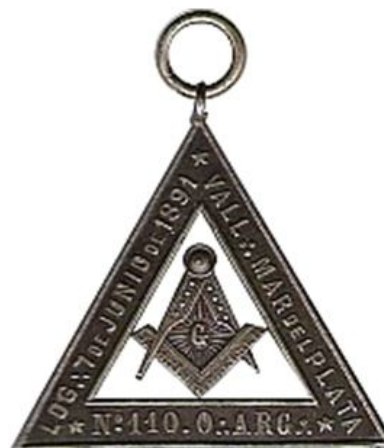
Logia Sol Argentino 160 n° 447 (Necochea)