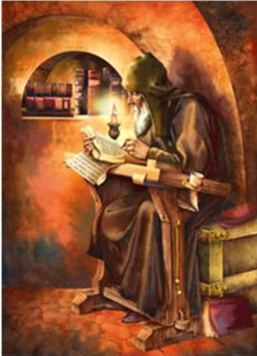
Néstor: "Padre de la historia de Rusia"

tomada por los mongoles convirtiéndose así en la primera ciudad en caer en manos invasoras.