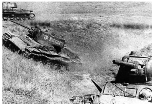
Tanques e infantería soviética peleando en cercanías de Kursk