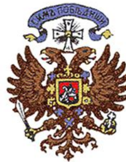
Escudo del Ejército Blanco de Kolchak