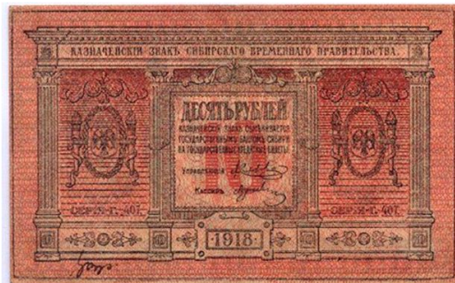
Billete de 10 rublos de 1918