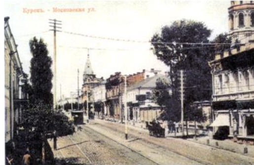
Kursk a principios del Siglo XX

En el marco de la segunda guerra mundial y la "Operación Barba Roja" Kursk cae en manos nazis el 3 de noviembre de 1941. Entre el 5 de julio y el 23 de agosto de