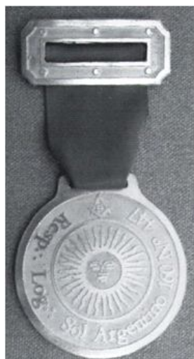
Logia Sol Argentino 160 n° 447 (Necochea)