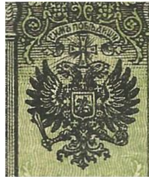
Escudo del billete en cuestión

Inglaterra, desde allí y con el apoyo de este país, se instaló en Omsk , Sibería, en donde destituyó al gobierno bolchevique y constituyó un gobierno autónomo contra revolucionario que contó con el apoyo de Francia e Inglaterra.