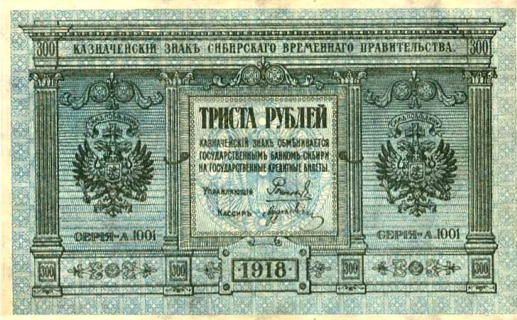
Billete de 300 rublos de 1918