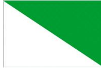
Bandera de la Rusia Blanca

que se muestran a continuación y un bono del tesoro por 25 rublos.