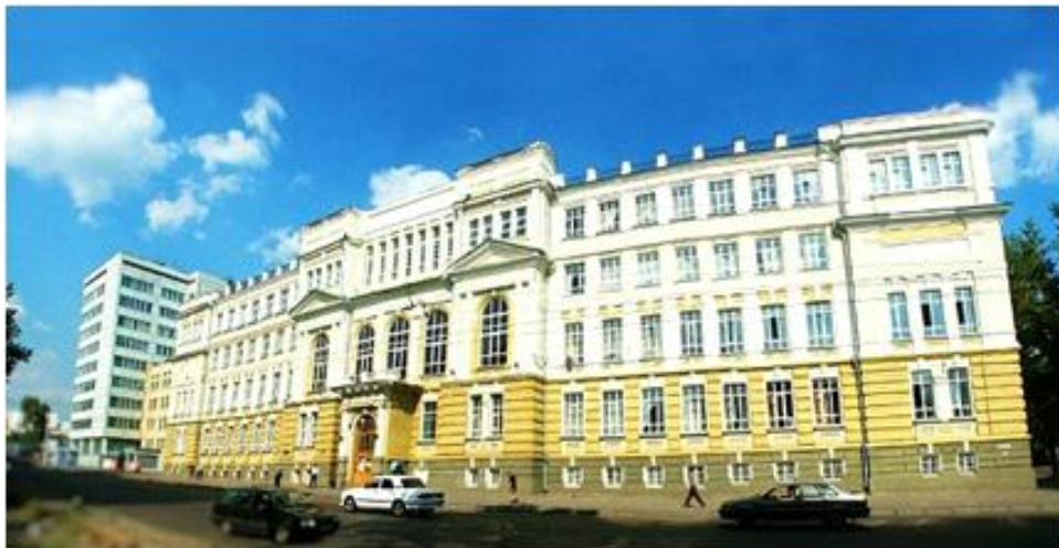
Edificio central de la Universidad Estatal de Kursk