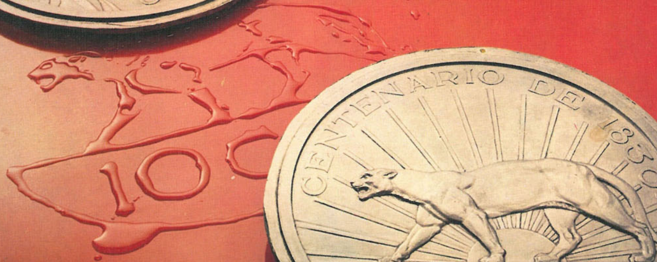
PLATOS DE LA MONEDA DE 10 c. "EL PUMA"

Moneda que integra la emisión conmemorativa 1830-1930. Diseñada por Alexandre Morlón, artista perteneciente al plantel de la Casa de la Moneda de París. Labrada en el estilo de las acuñaciones francesas de la época, tiene solo como elemento uruguayo el estilizado puma.