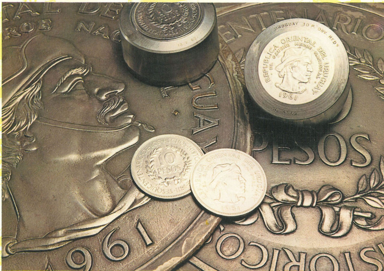
10 PESOS "EL GAUCHO" (1961)

Platos, cuñas y moneda correspondiente a la emisión obsidional de 10 pesos en plata. Fueron acuñadas en 1961 en homenaje al gaucho, héroe nacional y de los Hechos Históricos de 1811.