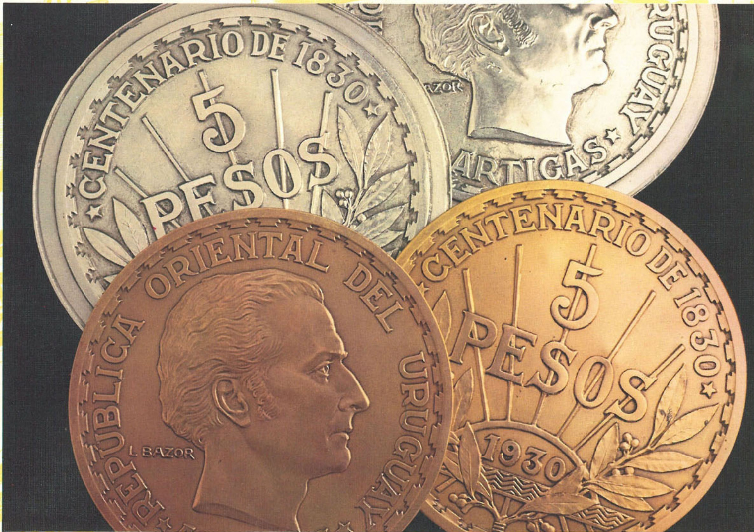
PLATOS DE LA MONEDA DE 5 PESOS "ARTIGAS"

Estos platos sirvieron de modelo a las monedas de oro emitidas para conmemorar el Centenario 1830-1930. Como moneda "obsesional" tuvo muy limitada circulación; de las 100.000 acuñaciones se colocaron 15.000 unidades, quedando las restantes como encaje aurífero del Banco.