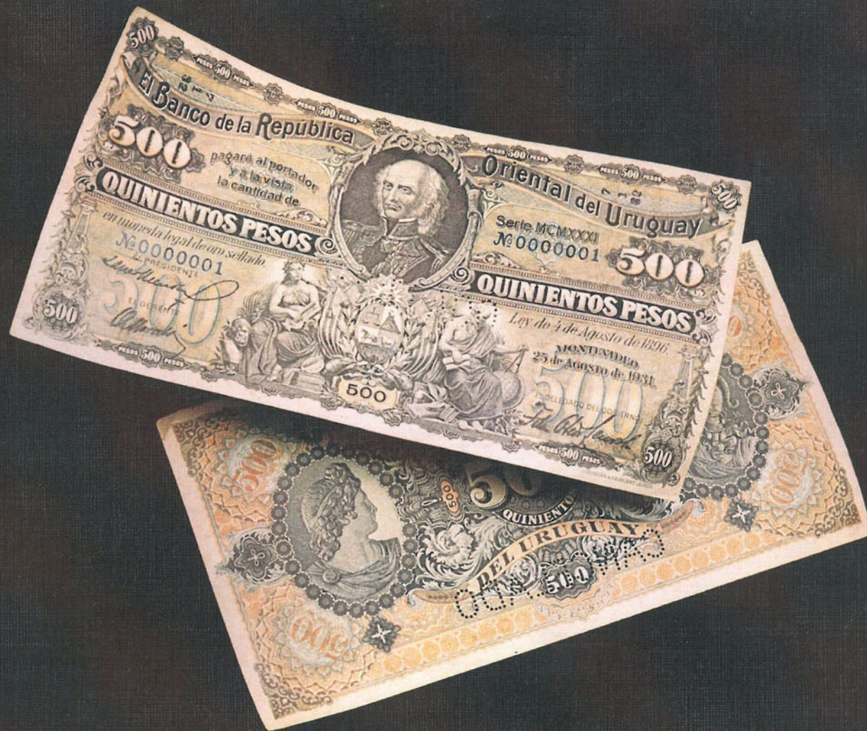
BILLETES DE 500 PESOS (1896)

Impreso por la firma Giesecke y Devrient (Leipzig, Alemania), con retrato de Artigas. Su fondo es ornamentado, animado con viñetas alegóricas y las armas nacionales. Está impreso sobre papel de pasta de cáñamo con dibujos de agua en claro, y con planchas de acero sobre fondos multicolores.