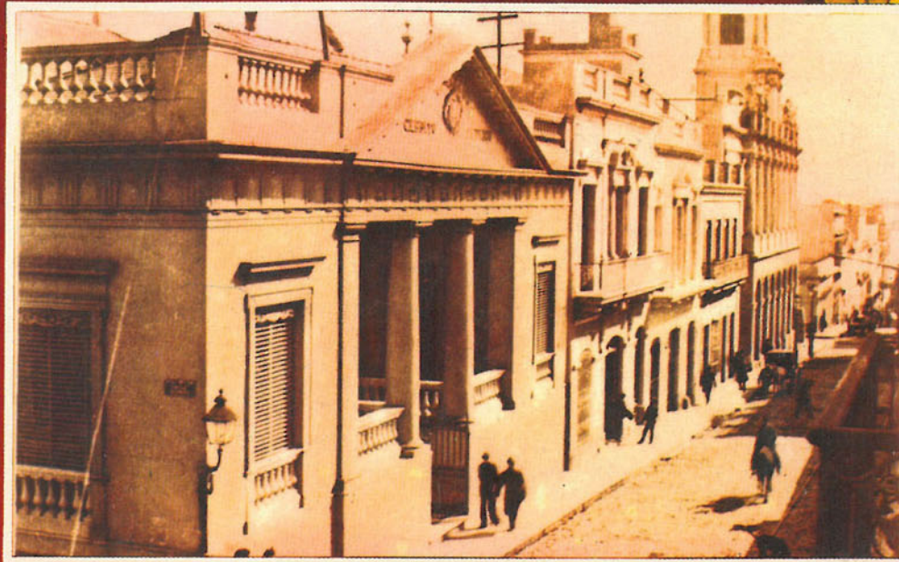
Edificio del Banco Italiano, erigido en 1866, que fue sede, sucesivamente, del Banco Unión, la Junta de Crédito Público, el Banco Nacional y la Casa Central del Banco de la República Oriental del Uruguay.

Es durante la guerra de 1914, que cesa la convertibilidad de billetes, esta resolución se adopta como defensa económica, financiera y de las reservas metálicas. Se prohibieron también las exportaciones de oro. Estas medidas se extendieron durante todo el período que el