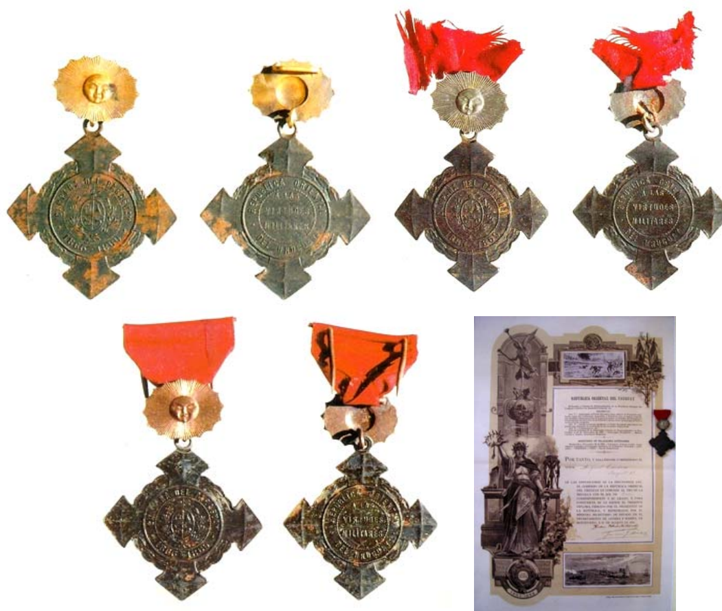
CONDECORACIONES SOL DE ORO, SOL DE PLATA, SOL DE COBRE Y DIPLOMA CON MEDALLA