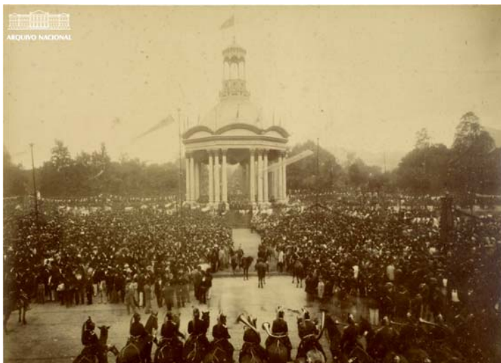
PABELLÓN DONDE SE PRODUJO LA ENTREGA DE LAS MEDALLAS EN RÍO DE JANEIRO

“HOMENAGEM/ A/ COMISSÃO MILITAR/ DA/ REPUBLICA DO URUGUAY/ 1894”