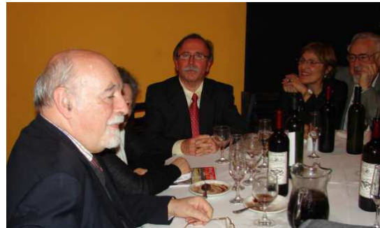
Cena de clausura - Imágenes