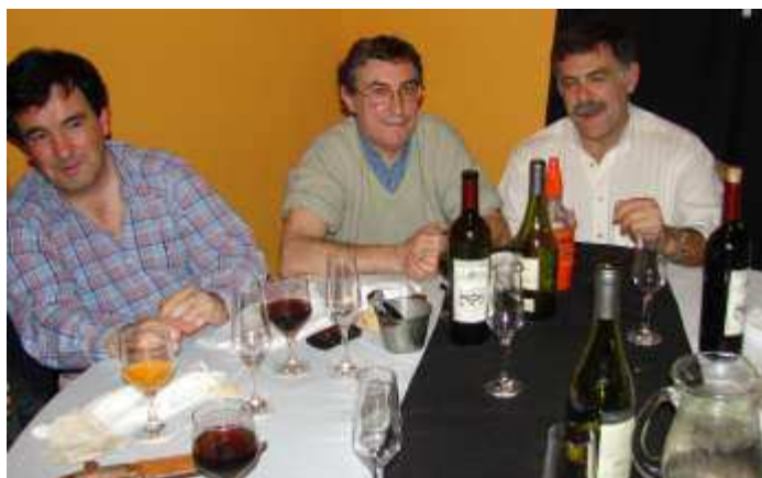
Después de unos vinos!!!