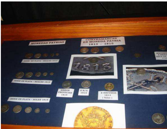
Monedas Patrias y contramarcas.

Además hubo muestras que incluyeron medallas políticas, vales papel moneda, fichas y latas de esquila, entre otras.