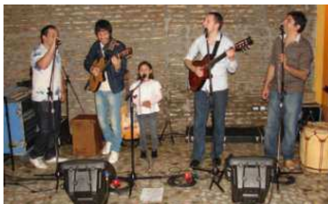
Disfrutando el show de "Alazanes"