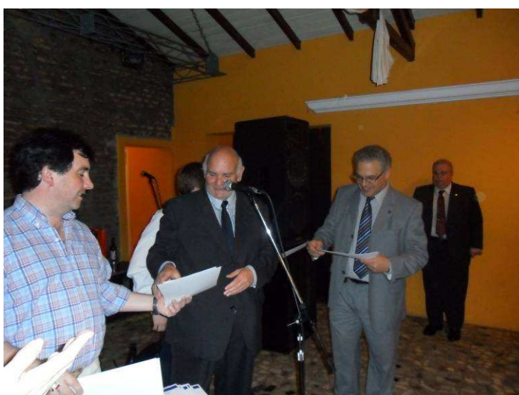
Cierre con entrega de Diplomas y medallas.