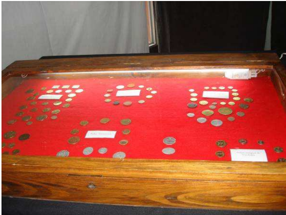
Muestra de fichas de distintas explotaciones, ingenios, quebrachales, forestales, vendimia antiguas, etc.