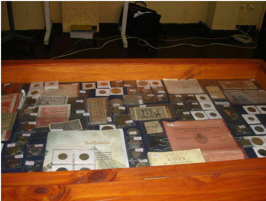
Lotes de subasta