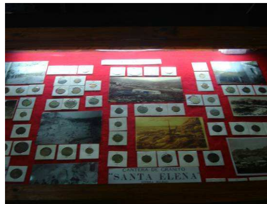
'Plecas de canteras de Tandil'