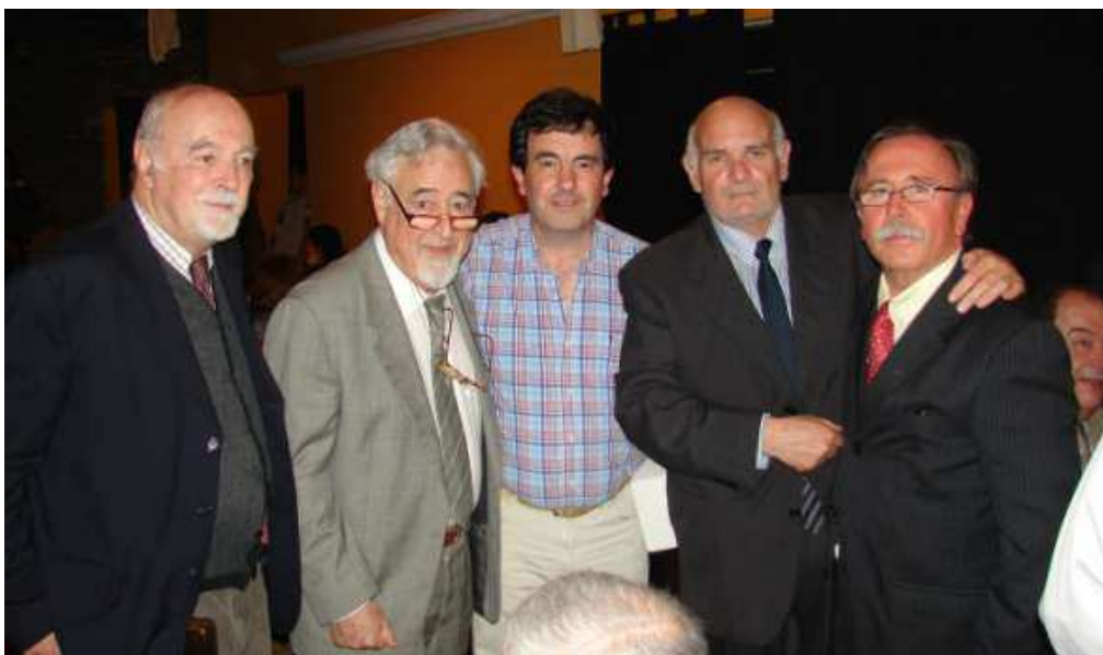
Cena de clausura - Imágenes